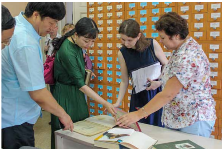
В отделе краеведения гостей заинтересовали книги о КВЖД.

Все они, являясь признанными экспертами в своём деле, высказали желание непременно посетить ДВГНБ, чтобы познакомиться с нашей ресурсной базой, в частности по теме «Российско-китайские отношения в сфере образования и науки, культуры и искусства».