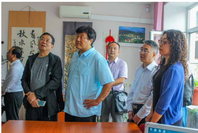
Гости из Поднебесной посетили зону информационных ресурсов на китайском языке.

В завершение экскурсионной программы китайские учёные побывали в Центре доступа к электронным ресурсам и межкультурных коммуникаций,