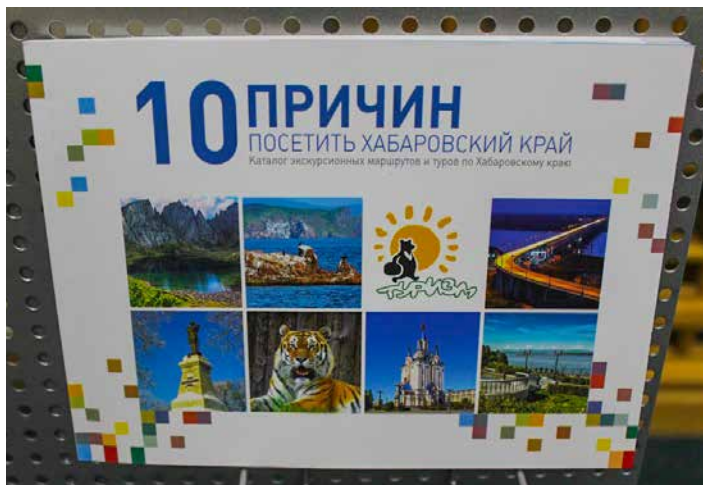
Этот каталог можно приобрести в ДВГНБ.

В основном здании библиотеки (ул. Муравьёва-Амурского, 1) создана зона видеопросмотра мультимедийных информационных продуктов, предоставленных