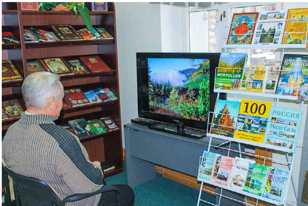
Информационно-туристический уголок «Жемчужное ожерелье Хабаровского края» в ДВГНБ.

туристической сферы региона. Библиотеки обладают уникальным опытом информационного сопровождения туристической деятельности.