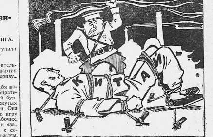
Последние сообщения из Китая говорят о могучем росте революционного движения в селах и городах.