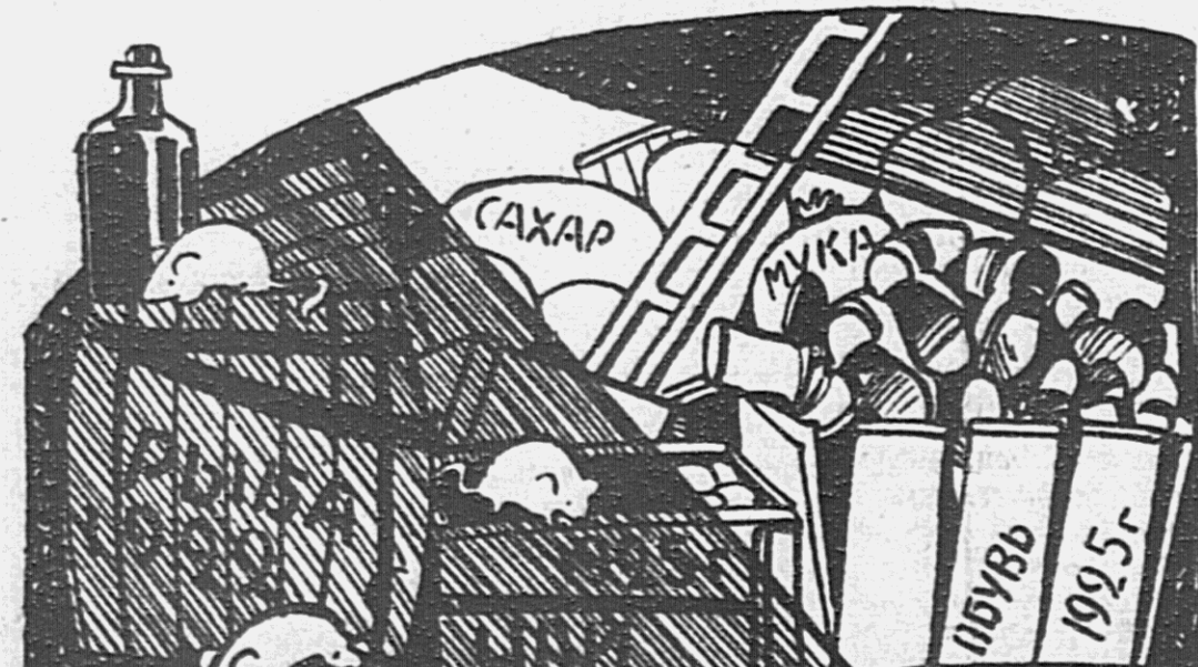
На кооперативной почве