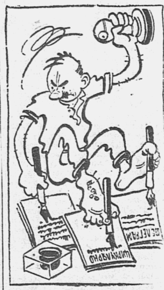
Техника ерундоватства районами, по которой надо бить.

С момента ликвидации округов крайком организации должны были сразу перейти к непосредственному