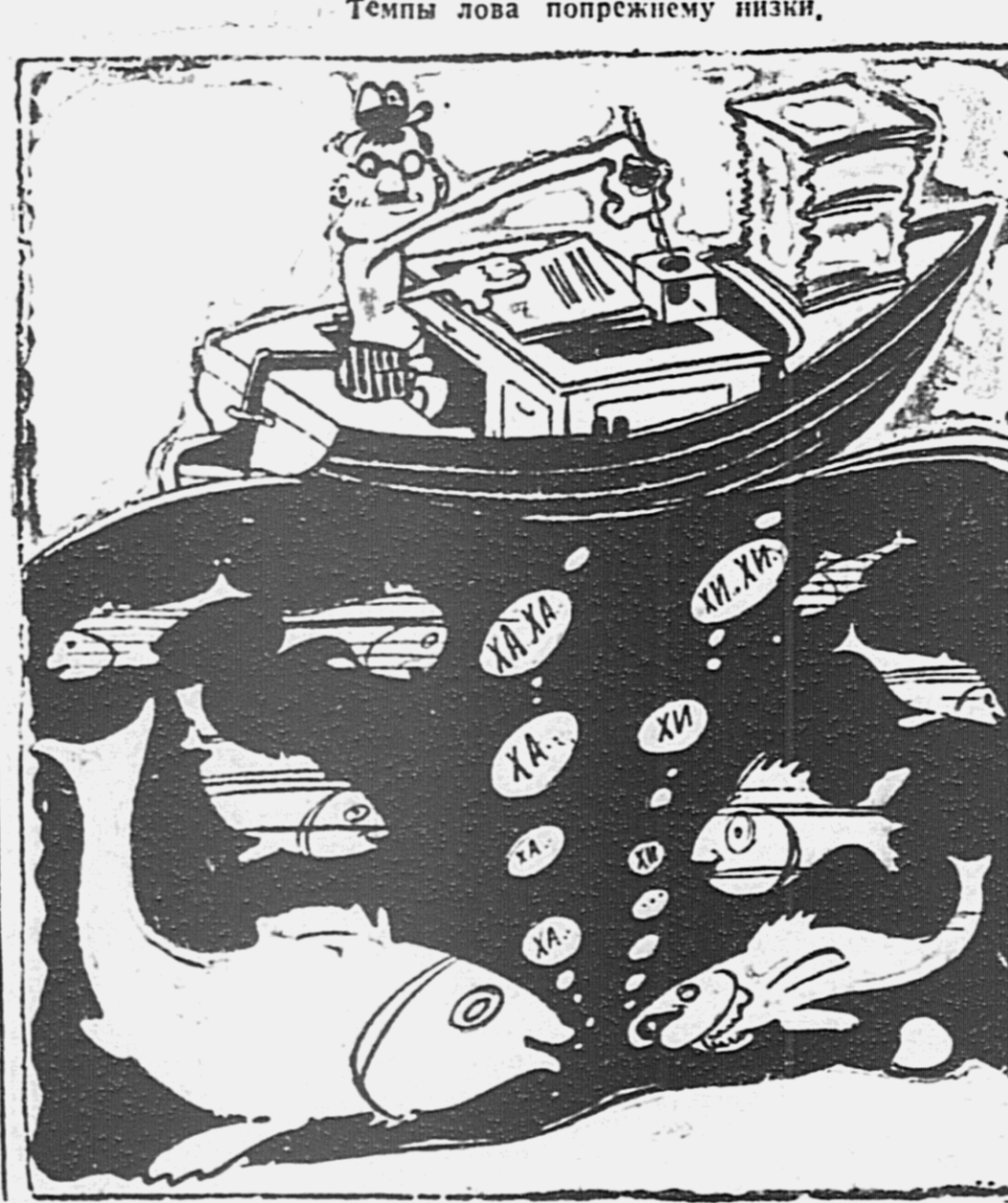
ГОЛОВУПЯ НА МЕСТЕ И РЫБА НА ДНЕ...