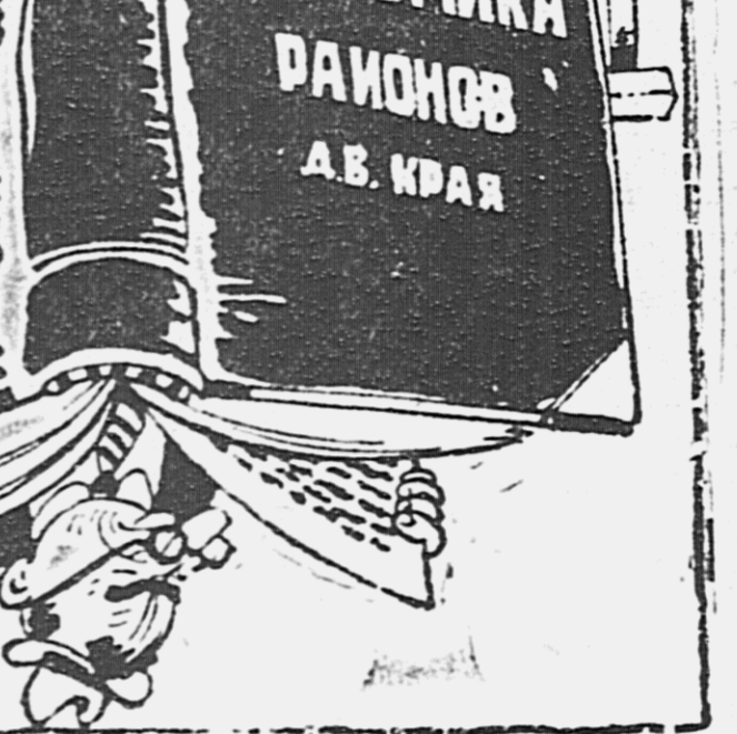
Как изучается экономика районов...

Кадр — все еще является самым местом районов. Надо готовить новые кадры, заниматься подготовкой имеющихся, но делают