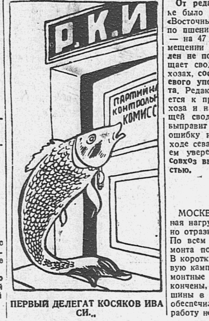
ПЕРВЫЙ ДЕЛЕГАТ КОСЯКОВ ИВА СИ.

Группа астраханских рыбаков, работающая на берегах Дальне-Восточного моря в бухте «Адина», выдвинула свой проект непрерывного бригадного лова гавси. Астраханцы создают группу лодочных пловцов, которая объединит пловцов, катер и несколько парусных или вельсовых кунгасов. Группа — плаваясь своим ходом, кунгасы на буксире за катером — выйдут в море на лов. Катер немедленно возвращается на берег и берет на буксир новые кунгасы без лодцов, но с миниметом мусельных катеров, и выбрасывает в море свежие сети. Катер увозит кунгасы с сетями к берегу, где производится отпечка рыбы, мойка и сушка сетей. Эта операция производится непрерывно. Таким образом, полностью осуществляется принцип не-прерывного лова — сети находятся в воде круглые сутки и возможности лова используются в максималь-ной мере. Слабой стороной этого проекта является необходимость наличия второго комплекта кунгасов. Однако, кунгасы в этом случае могут строиться более упрощенного и дешевого типа. Постоянное нахождение рядом с кунгасом моторного катера облегчает маневрирование лодочных единиц в море и обеспечивает переход их на места лучше-го лова. Астраханцы горячо поддерживают свой проект. Уже создана первая бригада, в которой каждый рабочий отвечает за свой участок.