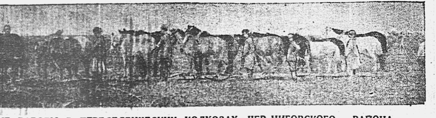
ПОЛЕВЫЕ РАБОТЫ В ПЕРЕСЕЛЕНЧЕСКИХ КОЛХОЗАХ, ЧЕРНИГОВСКОГО РАЙОНА.