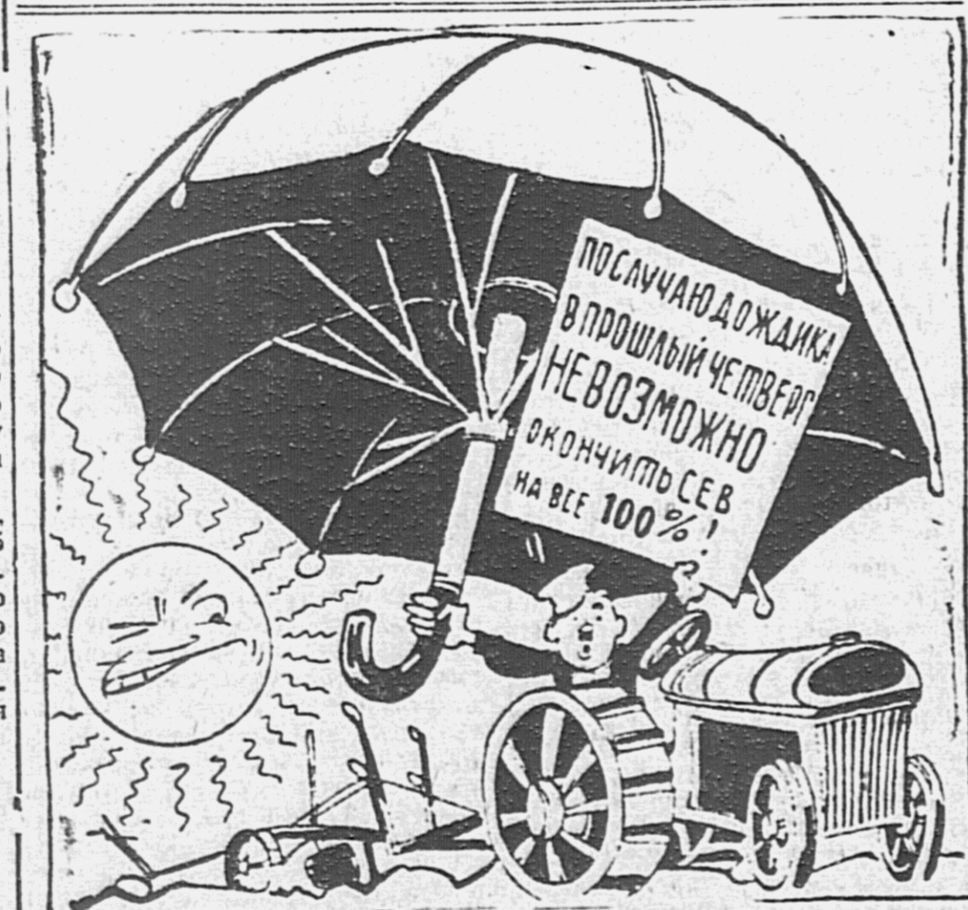
Не пора ли расстаться с зонтиком?