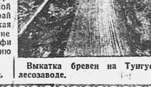
Выкатка бревен на Тугусском лесозаводе.

Перевозка грузов должна быть поставлена в центр работы Амурского речного транспорта.