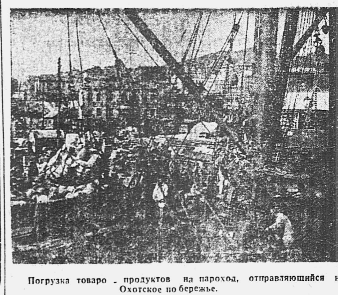
Погрузка товаров — продуктов на пароход, отправляющийся на Охотское по бермезе.

ГЕЙ, В МОРЕ! ОБРАЩЕНИЕ УДАРНИКОВ СЕЙНЕРА № 5 БУХТЫ ПОСТОВОЙ. Вместе с вами, мы, ударная команда пятого сейнера, в конце мая получили задание по активной разведке и лову иваси. Ни дождь, ни ветер, ни даже штормы не мешали нам беспрерывно искать иваси. Благодаря этому мы первыми обнаружили ход иваси. 18 июня, выходя за 120 миль от берега в море, увидели как иваси пошла огромными стадами. На следующий же день мы сдали на берег 25 центнеров. Осмейте, опозорьте того, кто, околичиваясь на берегу или отставаясь в бухтах, как попугай, твердит: «Иваси нет, иваси нет». Еще большому позору предайте тех, кто, обманывая общественность, шляется у берега, без дела, кто, по примеру команд 2 и 17 казаски, пьянствует, ломая и расширяя государственное имущество. Они — опора оппортунистов, пособники кулакам и вредителям. Они срывают программу третьего, последнего, года рыбной пятилетки, срывают индустриализацию страны, строительство новых предприятий, магистров, челябстроя, дальзаводстроя и МТС. Раз дали слово — по иваси занять первое место в крае, — так выполняйте его по-ударному, по-большевистски. Отныне самым позорным человеком считается лежачего на берегу, отстаивающего в бухтах. Помещите тот администратор, та партчейка и тот промок, чьи рыбаки так позорно ведут себя. — Гей, в море! На круглоустый лод иваси! УДАРНИКИ 5-го СЕЙНЕРА.