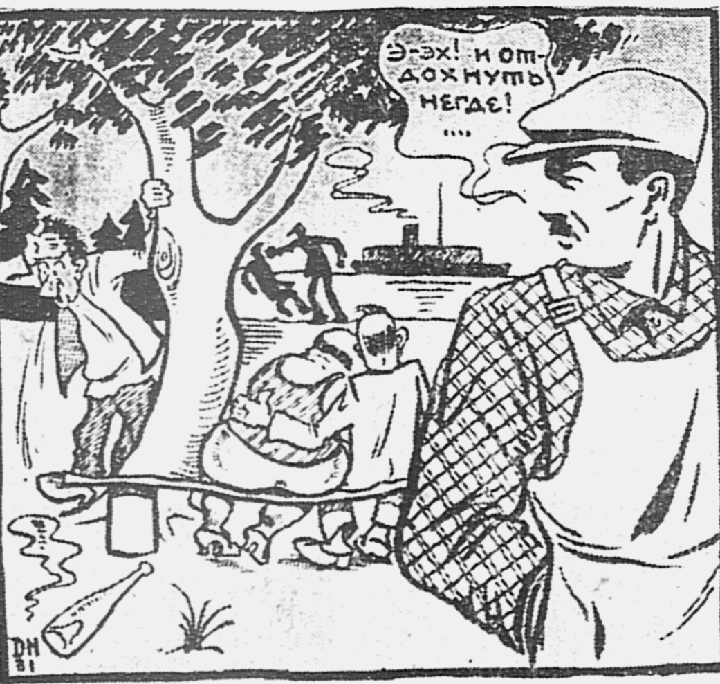
«КУЛЬТУРНЫЙ ОТДЫХ» В ГОРОДСКОМ САДУ.