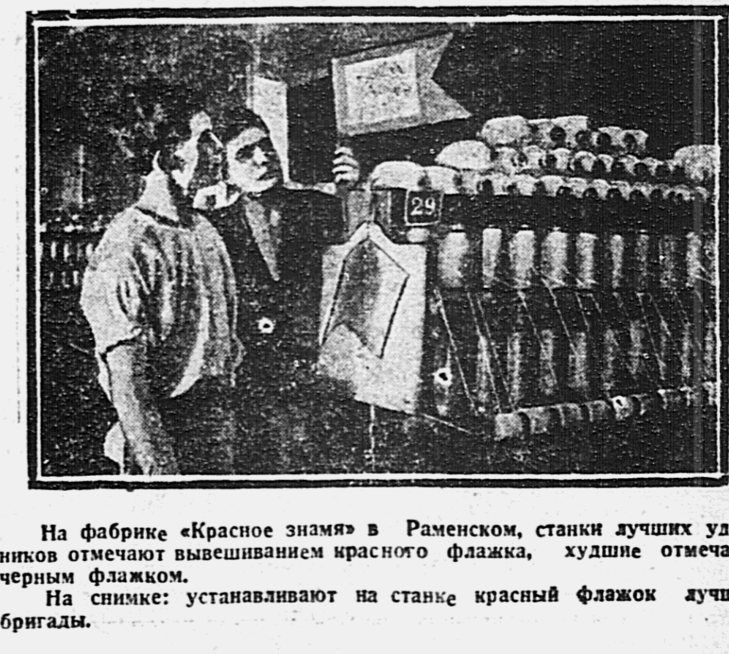
На фабрике «Красное знамя» в Раменском, стани лучших ударников отмечают вышиванием красного флага, худшие отмечают черным флажком. На снимке: устанавливают на стане красный флажок лучшей бригады.