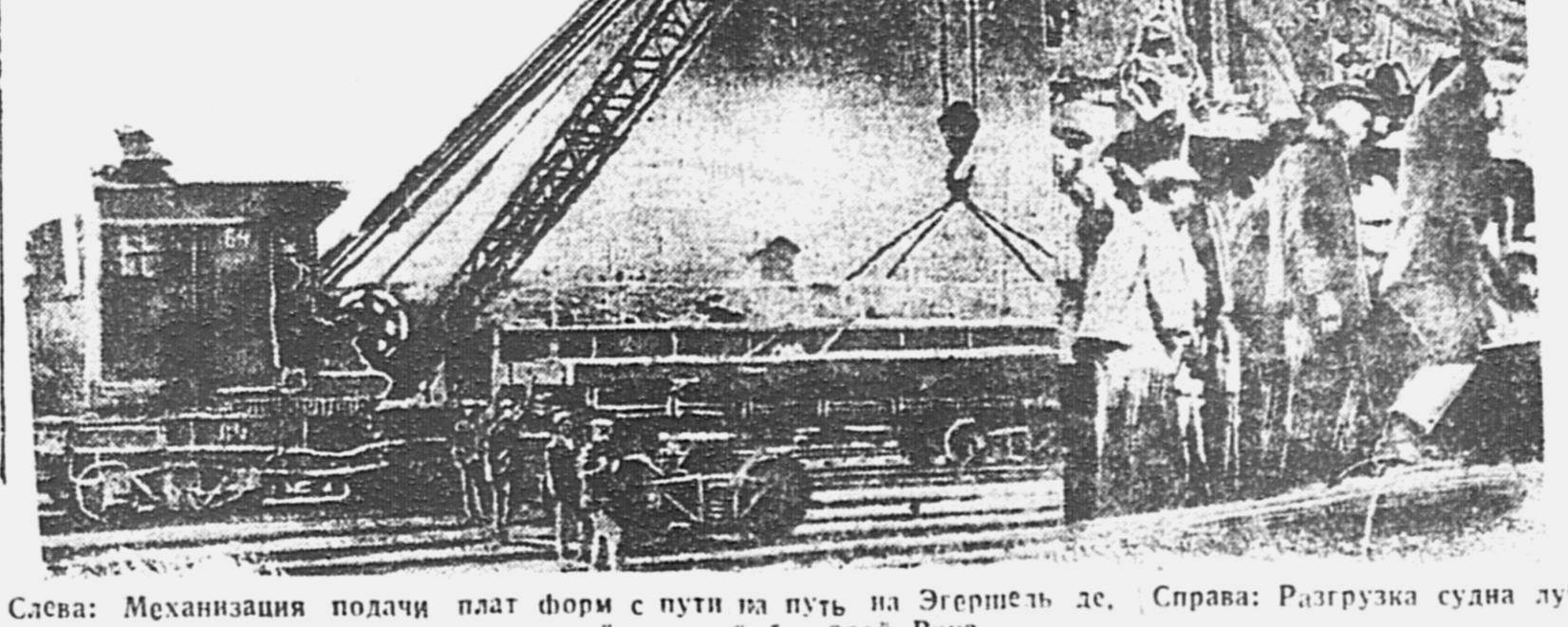
Слева: Механизация подачи плат форм с пути на путь на Эгершев дс. Справа: Разгрузка суана лучшей ударной бригады Вапа.

ПОСТРОЙКУ ПРИЧАЛОВ, РЕМОНТ ДОКОВ ЗАКОНЧИТЬ К НАЧАЛУ ОСЕННИХ ГРУЗОПОТОКОВ