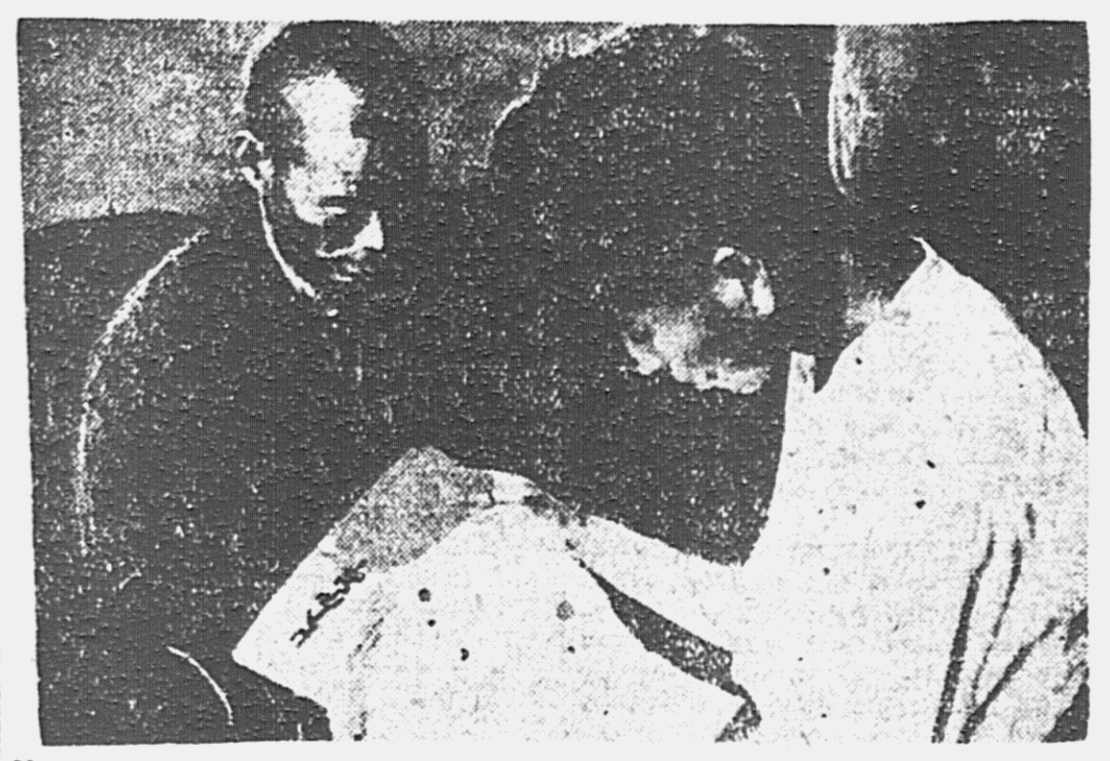
На краевом совещании по работе среди нацмен. В перерыве между приемами.

Печать — одно из актуальнейших средств, с помощью которого можно бороться со всякого рода шовинистическими и националистическими выпадами. Однако, многие из корейских этим орудием не пользуются. Приток корреспонденции в газету совершенно недостаточен. Газета далеко еще не проникла во все браки, квартиры и общежития корейцев. Долг каждого трудящегося корейца писать и распространять свою газету.