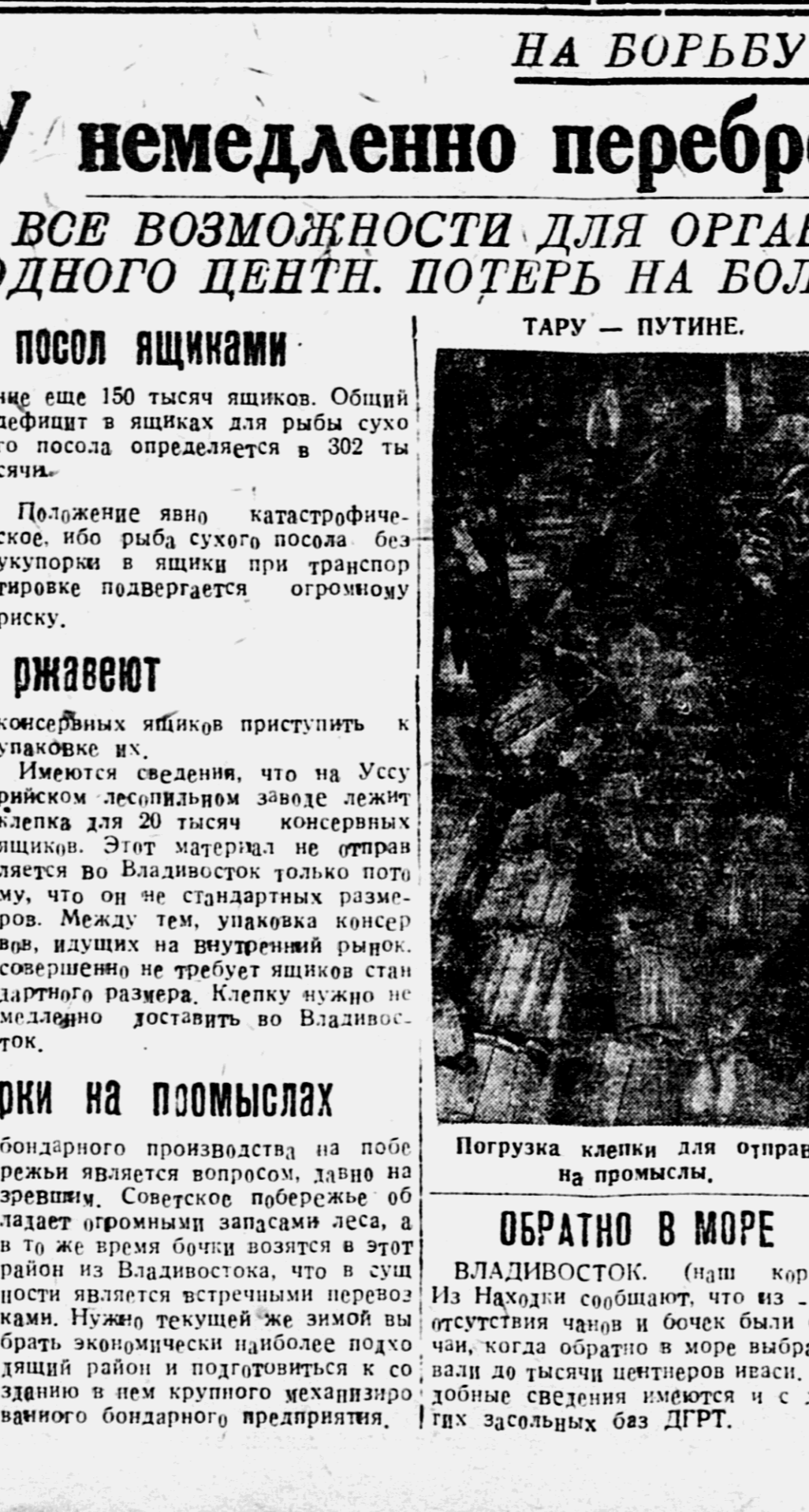
Погрузка клекки для отправки на промыслы.

Ното «Бузский» ЛПХ существует на бумаге. Близится к концу распределение работникам, положение в новых ЛПХ катастрофическое.