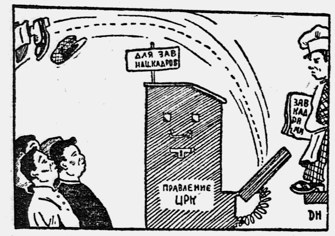
Несложная техника заводящая наемцами в ЦРК.

Ипполитовская МТС заше боевое задание по заборам в 18000 гектаров, составленное 97 прощ. нулич. Ипполитовской МТС заше боевое задание по заборам в 18000 гектаров, составленное 97 прощ. нулич.