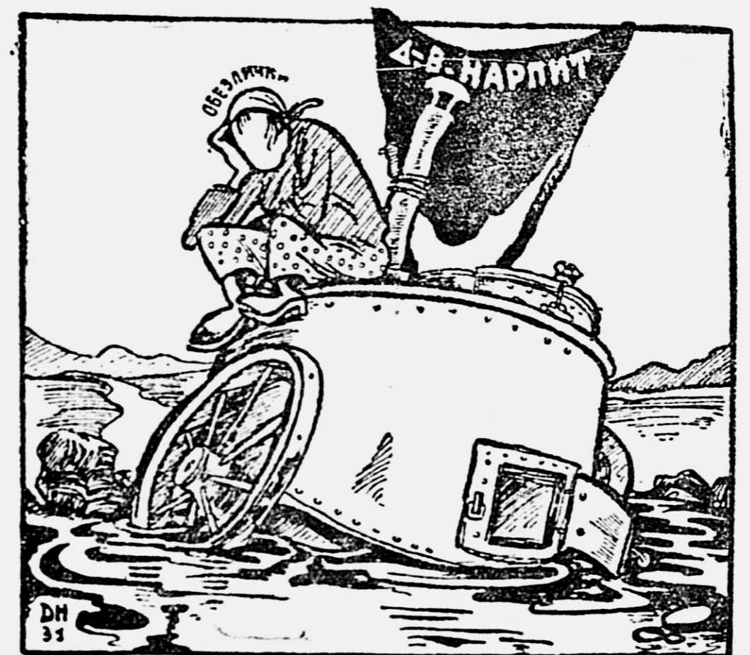
В походе до сих пор, несмотря на массу постановлений, директив, отношений и т. д., общественным питанием далеко от нас отстает. Попробуем — грязь, плохое качество, невнимательное обслуживание потребителя, бездельничанье.

Ипполитовская МТС заше боевое задание по заборам в 18000 гектаров, составленное 97 прощ. нулич. Ипполитовской МТС заше боевое задание по заборам в 18000 гектаров, составленное 97 прощ. нулич.