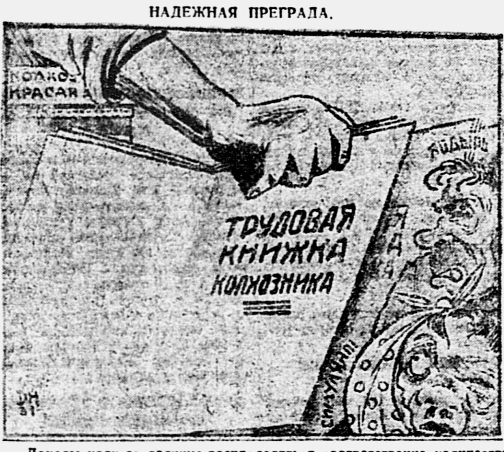
Доходы колхоза должны распределяться соответственно количеству и качеству труда...