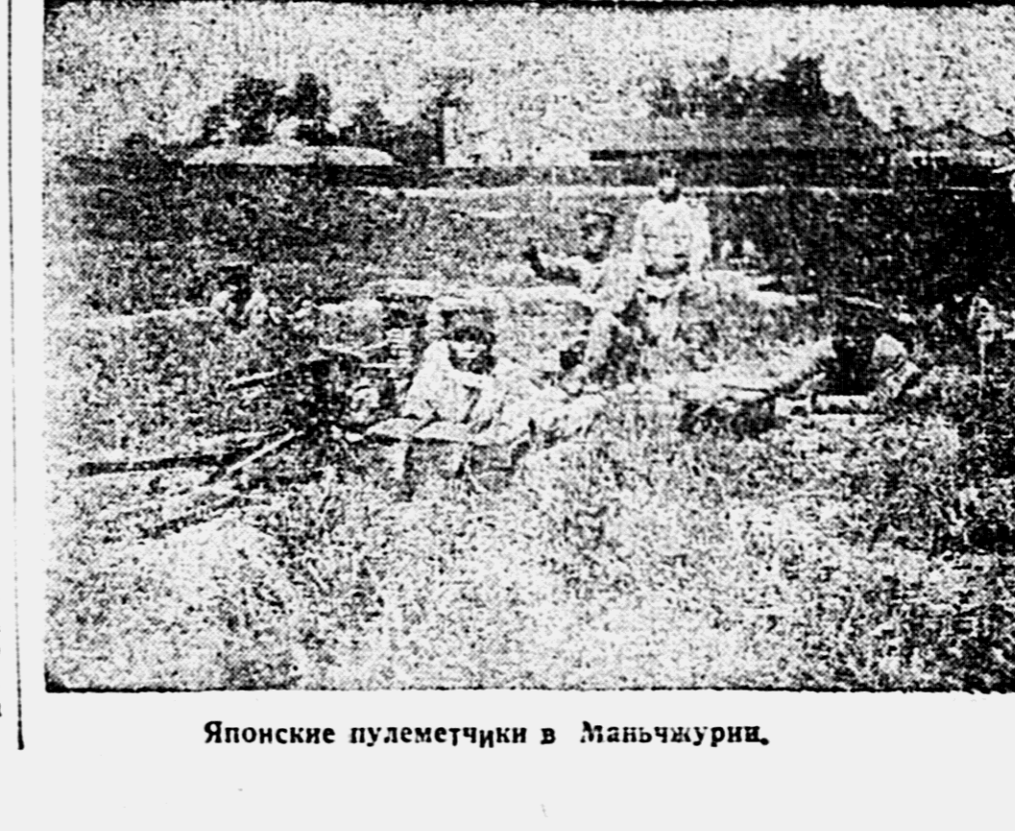
Японские пулеметчики в Маньчжурии.