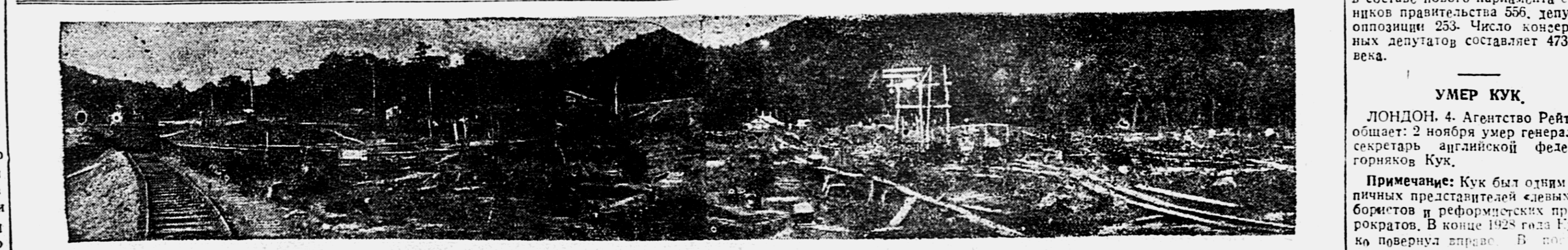
Общей лад Седанстроа

Примечание: Кук был одним из тех личных представителей «левых» дт борющихся и реформистских профсоюзных лидеров. В конце 1928 года Кук резко повернул спиной. В последние времена из-за болезни не участвовал в партизанской