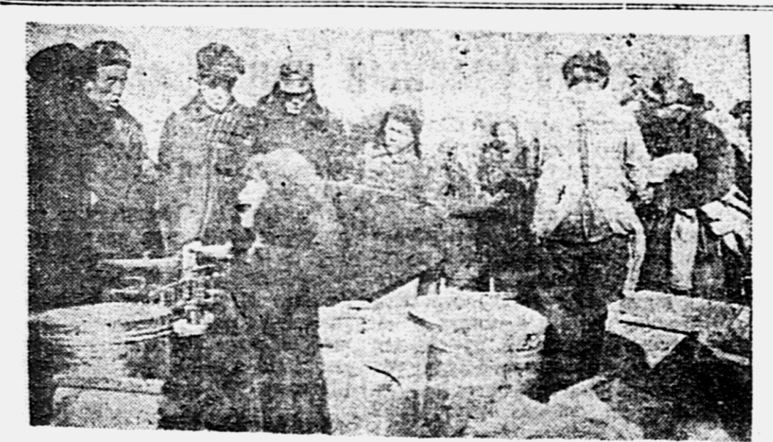
Лотки магазина № 11 Хабаровского ЦРК. Торгуют бойко. Однако, не видно, что это лотки кооперации, нет ни вывески, ни кооперативного планета.

Конкурс на лучший магазин Далькрайсоюза продлен до 1 января 1932 года. Одновременно с конкурсом на лучший магазин, Далькрайсоюз и редакция «Тихоокеанская звезда» объявляют конкурс на лучший магазин в краевом конкурсе — 23 декабря. За лучший магазин в конкурсе будет выдана премия в 100 рублей. Материалы по конкурсу можно направлять в редакцию или в конкурс в количестве, не превышающем участие все трудящиеся