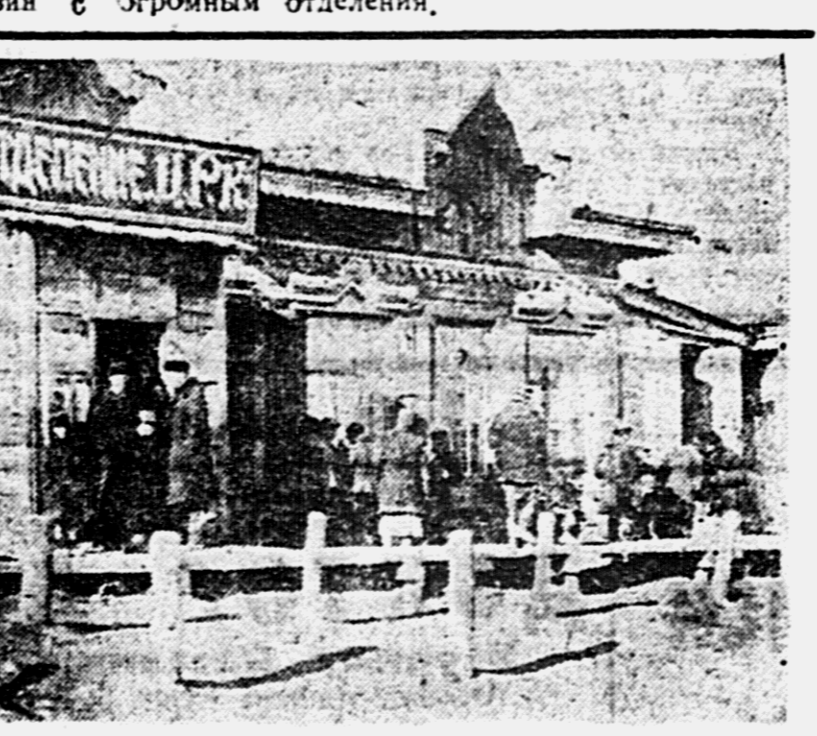
Магазин № 11 Хабаровского ЦРК, получивший премию в конкурсе на лучший магазин в крае.

Есть, конечно, недостатки и в этом магазине. Но они не являются серьезными. Магазин ЦРК и недостающего расширения общественно-массовых начал в работе магазина. Головному аппарату ЦРК его партийной и профсоюзной работы не прийти на помощь ударникам 11 октября магазина с огромным