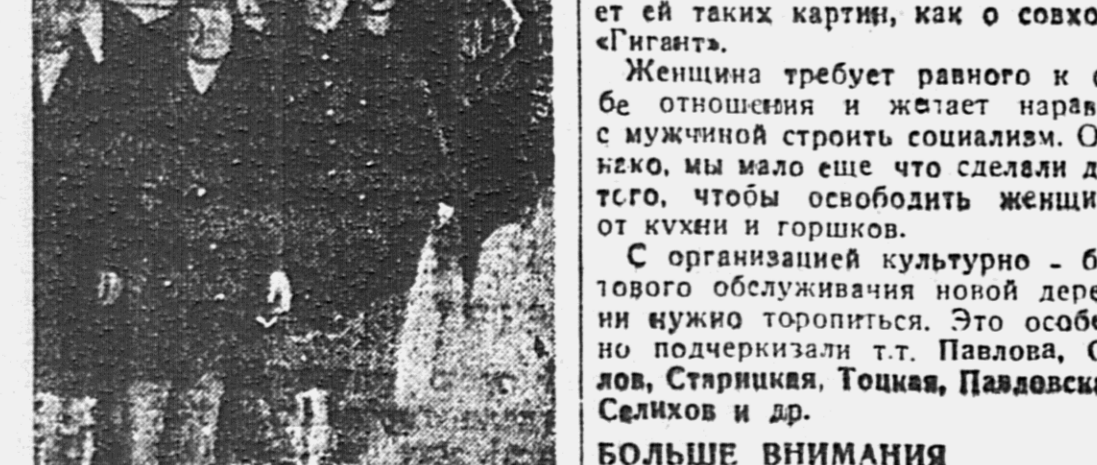
Делегаты камчатского района.

Вторым волнующим вопросом являются организационные недостатки в руководстве колхозным движением и подготовки к севу. Почти каждый выступавший говорил об этом. Сельсоветы плохо руководят кол.