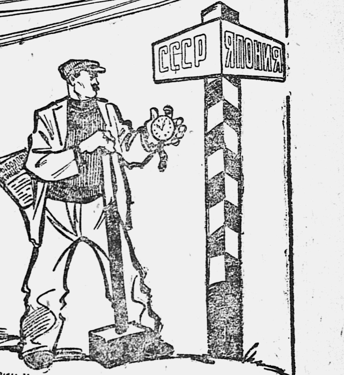
ЧЕМ ДАЛЬШЕ МЫ ЖДЕМ ОТВЕТА НА НАШУ ноту, тем дороже нам это будет стоить.