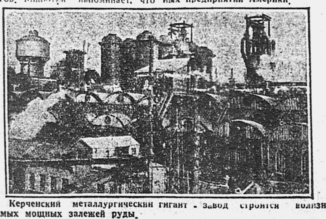
Керченский металлургический гигант - завод строится вылез в самых мощных залежей руды.

В 1937 году увеличится более чем в 15 раз (180 миллионов тонн). Добыча чугуна за тот же период возрастет с 2 миллионов тонн до 27 миллионов тонн. Для того, чтобы учесть значение этих цифр, надо вспомнить, что все наше производство чугуна к концу пятилетки запланировано в 17 миллионов тонн. Оди УСК по производству чугуна обгонит Германию и по своим размерам он на много превзойдет Францию.