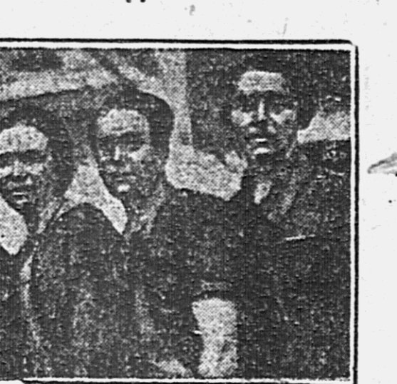
Ткачки Меланжского комбината в Шуге в ответ на вредительство мешельщиков перешли работать с 8 на 12 станков.

держивает выпуск заказанных емкостью двух лет водоналивных барж. Темп судоремонта на Дальзагоде диаметром промтовозов растет по мере расширения в самом разгаре, а суда стоят на причале в ожидании ремонта. Это приводит к тому, что из-за недостатка на томочка приходится брать чартер иностранных судов, тратить валюту.