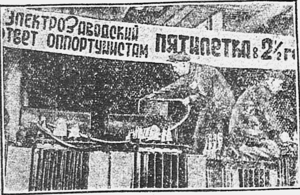
МОСКОВСКИЙ ЭЛЕКТРОЗАВОД ВЫПОЛНИЛ ПЯТИЛЕТКУ В 2 1/2 ГОДА. НА СНИМКЕ: УДАРНИКИ ТРАНСФОРМАТОРНОГО ОТДЕЛА ЗА РАБОТОЙ.