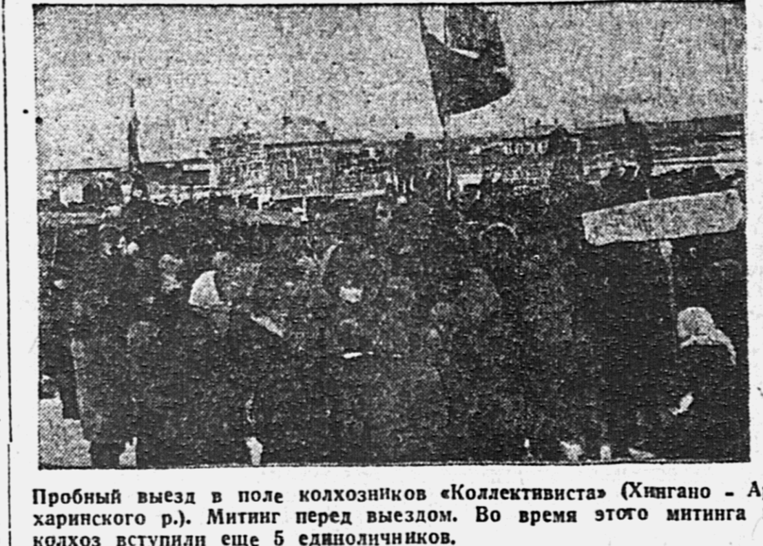
Пробный выезд в поле колхозников «Коллективиста» (Хингано - Архипово р.). Митинг перед выездом. Во время этого митинга в колхоз вступили все 5 индивидуальных колхозников.

ВЛАДИВОСТОК. Темпы лова сельди попрежнему остаются не удовлетворительными. Колхозы «Песчаный» за последние десять дней поймали ТОЛЬКО 389 ЦЕНТНЕРОВ. В бухте Славянка за последние пять дней поймана ТОЛЬКО 166 ЦЕНТНЕРОВ, по восточному берегу Уссурийского залива — 215 центнеров, НА БАСАРГИНЕ — 59 ЦЕНТНЕРОВ.