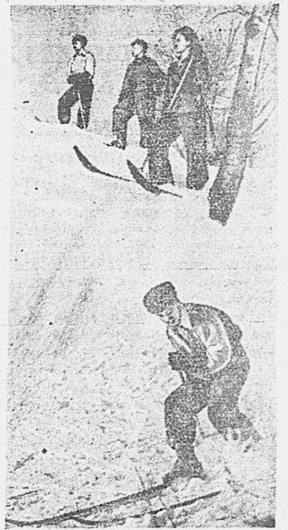
Крутой поворот.

Как передает агентство Ассошиейтед Пресс, Верховное командование Таи объявило, что войска Таи пересекли границу Французского Индо-Китая в районе Араи-Прадета и оккупировали несколько деревень.