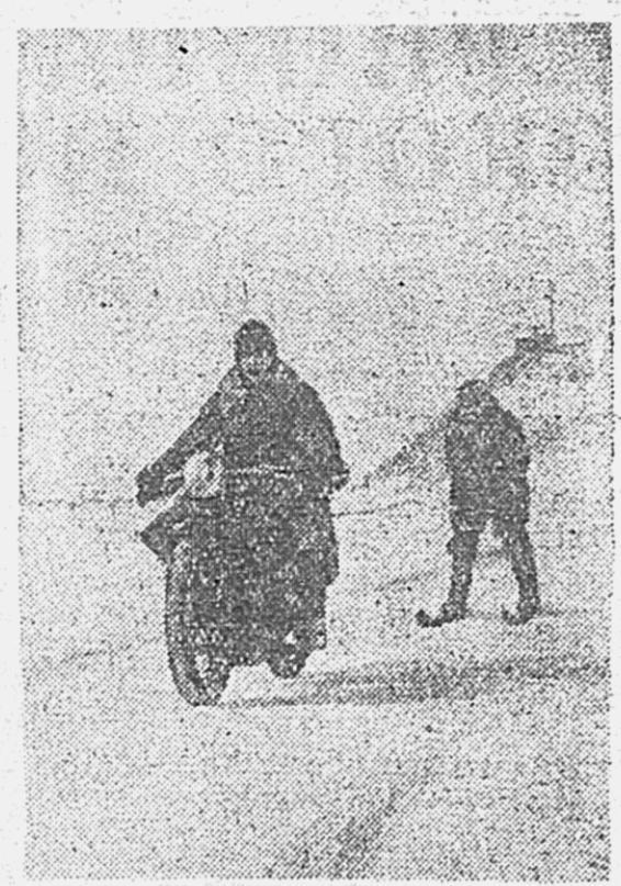
Культуртрекеры спортивного общества «Дальневосточный строитель» на лыжной тренировке. Буксировка лыжника за мотоциклом.

Сведений о положении в Северном и Южном Китае нет.