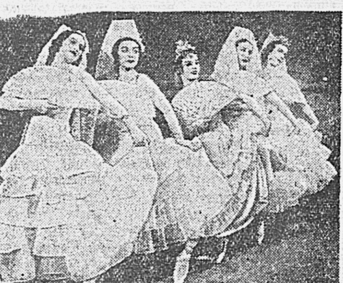
Премьера балета «Лауренсия» (музыка Крейна) в Государственном театре оперы и балета Латвийской ССР (Рига). На снимке: танец с покрывалами.

★ ★ НОВЫЕ СУДА РЕЧНОГО ФЛОТА МОСКВА. Приказом Наркома речного флота присвоены наименования судам, строящимся для речного транспорта. Пароходам для линии Нижне - Иртышского и Енисейского пароходства даны названия: «Советская Прибалтика», «Советская Буковина», «Литва», «Латвия», «Эстония», «Полководец Суворов», «Полководец Кутузов», «Полководец Баграцион», «Адмирал Макаров», «Адмирал Нахимов», «Адмирал Ушаков», «Сютковский», «Паркомпрос» и «Бородин».