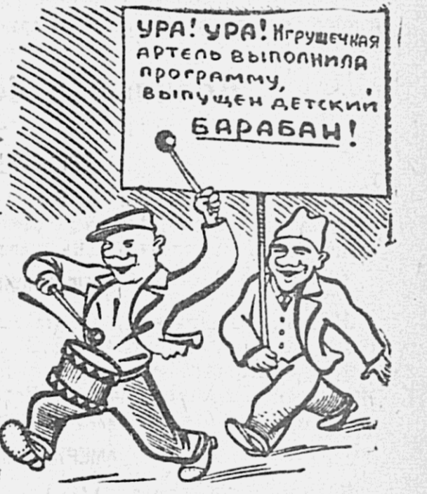
Рис. Ин. Горбунова.

Многие артели и союзы в своей работе не ходят из интересов трудящихся, а из погоня за прибылями. Хабаровская артель «Шалочник» с выполнением годового производственного плана справилась неплохо. Однако, удельный вес основных изделий, то-есть головных уборов, составил здесь всего 34,5 процента всей продукции. Два трети заняты прочие изделия. Биробиджанская артель «Длинопрото» изготовляет все, что угодно, кроме того, что предусмотрено ее уставом. Благодненская артель «Механизм» вместо производства бытового ремонта, увлеклась крупными заказами на различные монтажные работы.