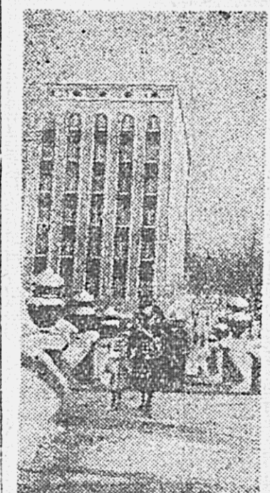
Столица Эстонской ССР — г. Таллин. На снимке: здание Наркомата легкой промышленности Эстонской ССР.