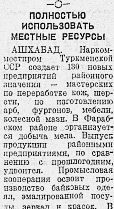
Полностью использовать местные ресурсы. АШХАБАД. Наркомэконом Туркменской ССР создает 130 новых предприятий районного значения — мастерских по переработке кож, шерсти, по изготовлению арб, фуруров, мебели, колесной мази. В Фарахском районе организуется добыча мела. Выпуск продукции районными предприятиями, по сравнению с прошлым годом, удвоится. Промысловая кооперация освоит производство байковых одежд, эмальированной посуды, зеркала и красок. В Кизил-Арвате и Тахта-Базаре организуются ковровые мастерские. (ТАСС).

ЧЕБОКСАРЫ. Закончился республиканский слет молодых передовиков сельского хозяйства. 280 делегатов прибыли на лыжах, пройдя 50-200 километров.