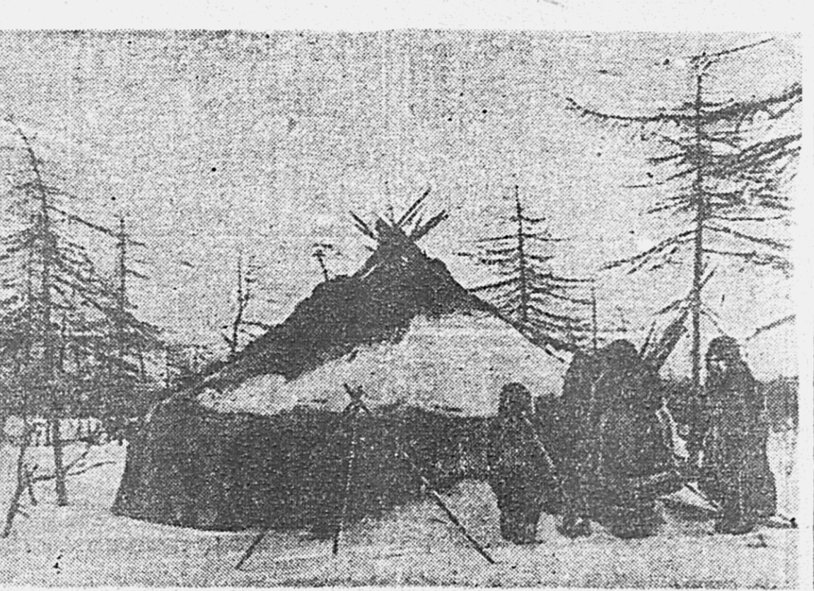
В ноябре 1940 года жители поселка Армань (Колыма) ушли из последних юрты в новый колхозный дом. На снимке: котелники у старой юрты перед отъездом в колхоз