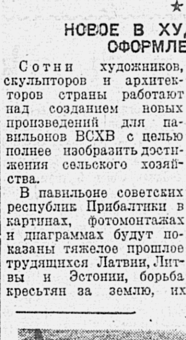
Новое в художественном оформлении ВСХВ. Сотни художников, скульпторов и архитекторов страны работают над созданием новых произведений для павильонов ВСХВ с целью полнее изобразить достижения сельского хозяйства. В павильоны советских республик Прибалтики и диаграммах будут показаны тяжелое прошлое трудящихся Латвии, Литвы и Эстонии, борьба крестьян за землю, их подвальный труд. Панно расскажут о незабываемых днях установления Советской власти в прибалтийских республиках и о выборах депутатов в Верховный Совет СССР. В Главном павильоне посетители ознакомятся с достижениями народов 16 союзных республик. Зал Сталинской Конституции дополняется четырьмя панорамами природы и экономики Латвии, Литвы, Эстонии и Молдавии. (ТАСС).

ЛЕНИНГРАД. В этом году промкооперация Ленинграда даст продукции на 1.550 миллионов рублей. Организуется ряд новых производств, увеличивается выпуск электротехнических приборов, эмальированной посуды, стальных часов, будильников.