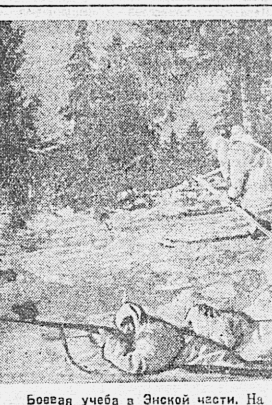
Боевая учеба в Зинской части. На снимке: подразделение в наступлении.

Над тайгой спустилась ночь. Знакомые днем предметы приняли фантастические очертания. В далеком безоблачном небе загорались звезды. Вместе с ночью пришла и таинственная тишина, когда при загуче морозе далеко слышен каждый шорох, хруст ветки, каждый непонятный ночной звук.