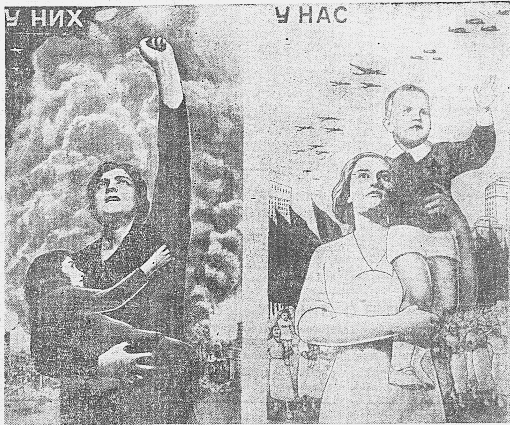
Фото-монтаж художника В. Короткого.