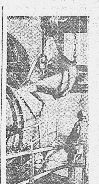
Кировградский металлургический завод — в первом ряду Всесоюзного соревнования работников цветной металлургии. На снимке: заправка конвейера штейном на Кировградском металлургическом заводе (Свердловская область).

700 МЕСТОРОЖДЕНИЙ ПОЛЕЗНЫХ ИСКОПАЕМЫХ Недавно один из жителей Свердловска обнаружил у озера Шартан залежи чистого горючего хрупала. В центре города при рытье канавы рабочие натолкнулись на свинцовое орудение. К югу от этого места при строительстве дома в котлованах были найдены куски свинцового блеска. Под зданием Дворца шпонеров проходил кварцевая жила с богатой содержанием золота. За последние три года в течение месяца на проверку заявки Уральского геологического управления пришла около 700 заявок на обнаруженные месторождения различных металлов и минералов. Значительная часть их — на территории Свердловска.