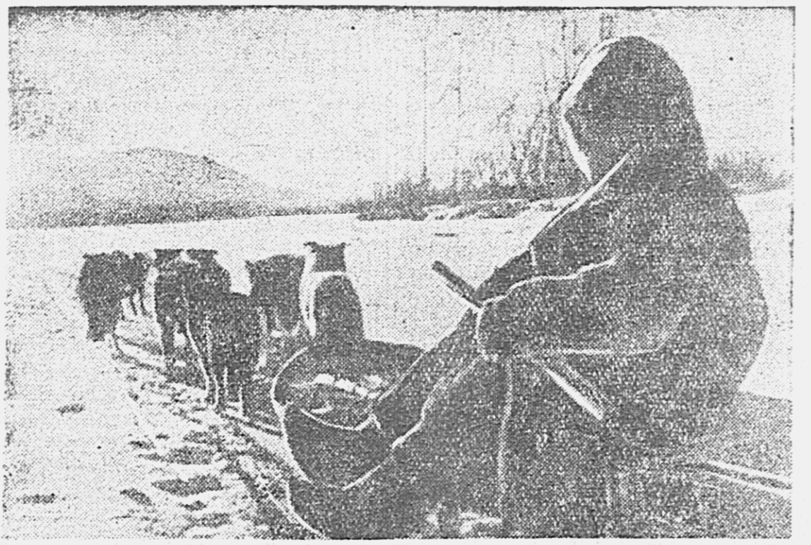
По нашему краю. На снимке: зямияя дорога на Колыме. Кавор колхоза «Пробужденный север» возвращается в колхоз.

ТОКИО, 7 марта. (ТАСС). Японская печать снова поднимает вопрос о необходимости укрепления кабинета Конэ. В политических кругах страны полагают, пишет газета «Хоци», что кабинет Конэ обладает сейчас меньшей силой, чем в период его формирования. Ассоциация помощи тропу не оправдала возлагавшихся на нее надежд. Когда создавалась ассоциация помощи тропу, пишет газета, имели в виду создание новой структуры в Японии и усиление военной мощи страны. Однако после вхождения в кабинет Конэ барона Хираюма и генерал-лейтенанта Янагава план создания новой экономической структуры подвергся нападкам финансовых кругов и в результате был обречен на провал. Во время сессии парламента правительство не смогло проявить необходимой твердости в отношении тех членов парламента, которые выдвинули против ассоциации помощи тропу. Представители правительства не смогли даже дать единого ответа на интерpellацию по этому вопросу. Газета подчеркивает, что многие разочарованы деятельностью кабинета Конэ, несмотря на то, что со дня его формирования прошло всего полгода.