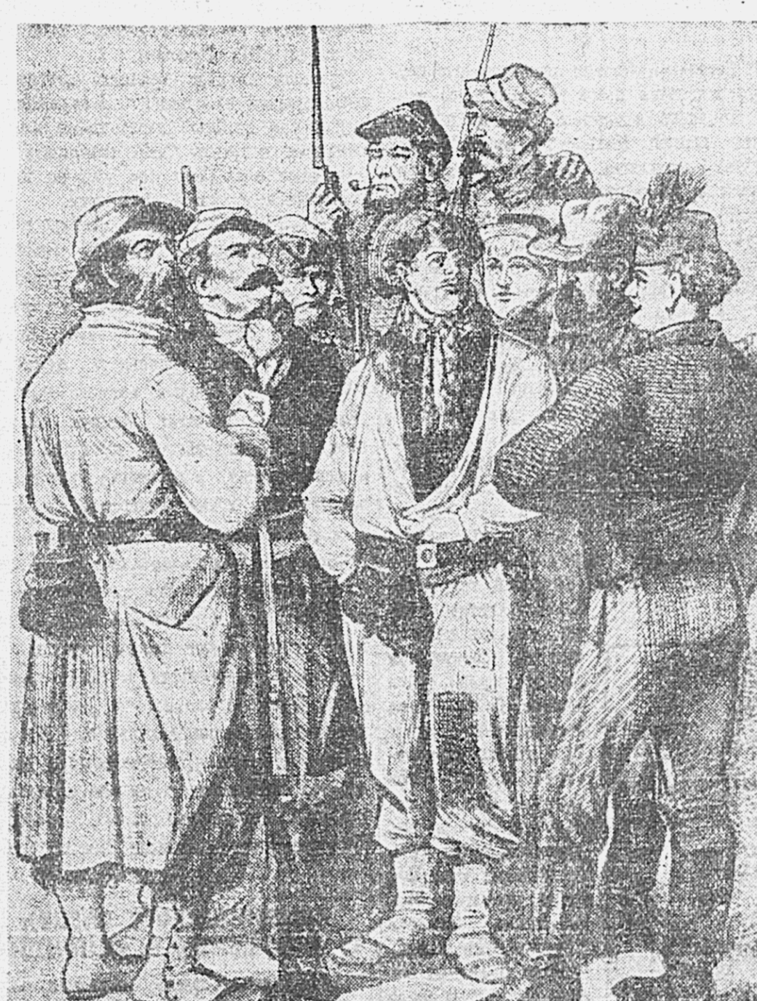
Коммунары Парижской Коммуны 1871 года.