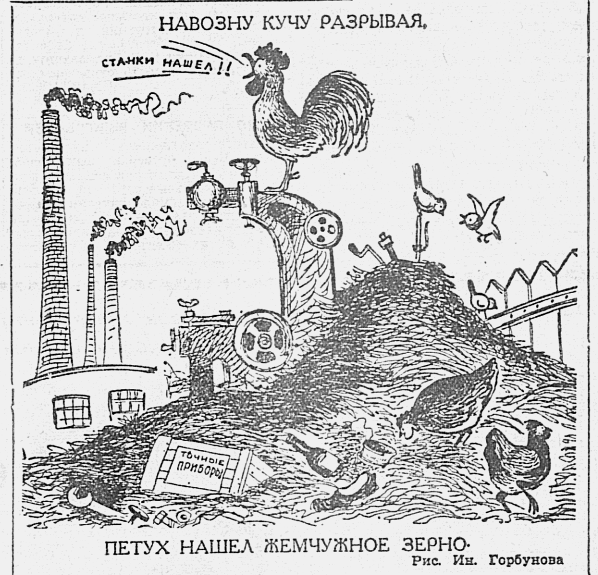
ПЕТУХ НАШЕЛ ЖЕМЧУЖНОЕ ЗЕРНО. Рис. И. Горбунова

Д. ВЕРХОТУРОВ. Секретарь партбюро Вяземского леспрохоза.