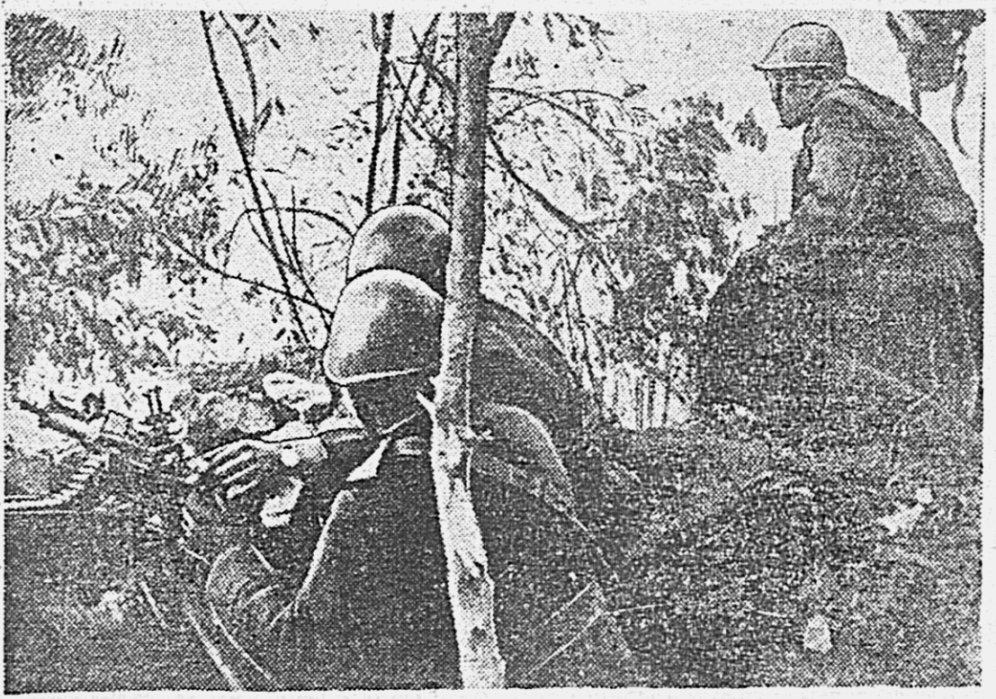
Итальянская огневая пулеметная позиция на греко-албанском фронте.

КРАЕВОЙ ТЕАТР МУЗКОМЕДИИ 5 и 6 апреля — ЗАРЯБЫЕ СПЕНТАКЛИ.