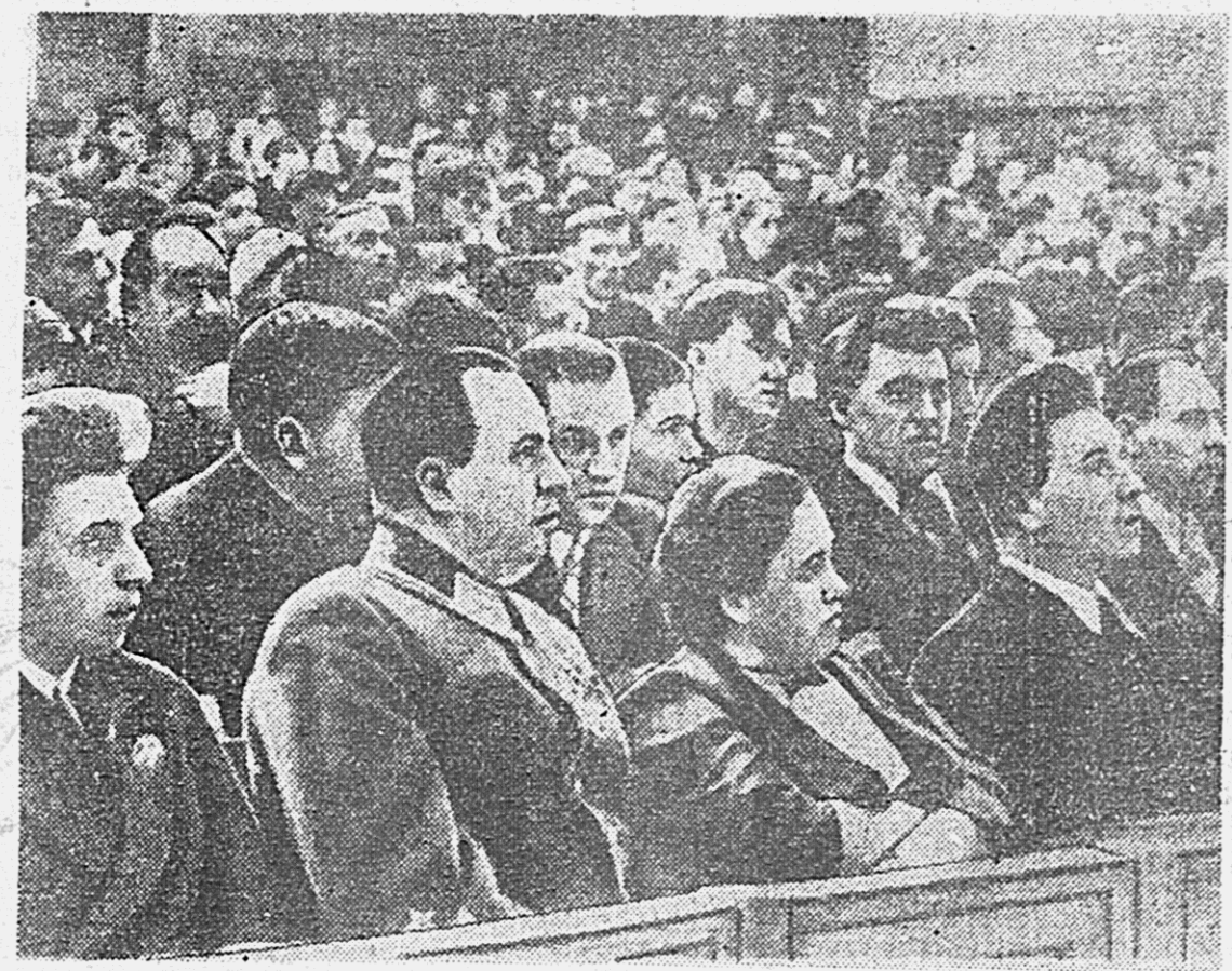
3 апреля в зале заседаний Верховного Совета РСФСР, в Кремле, открылась четвертая Сессия Верховного Совета РСФСР. На снимке: в зале заседаний. (Снимок передан из Москвы по беспроволочному аппарату).

На этом заседании заканчивается. Следующее заседание 4 апреля в 11 часов утра. (ТАСС).