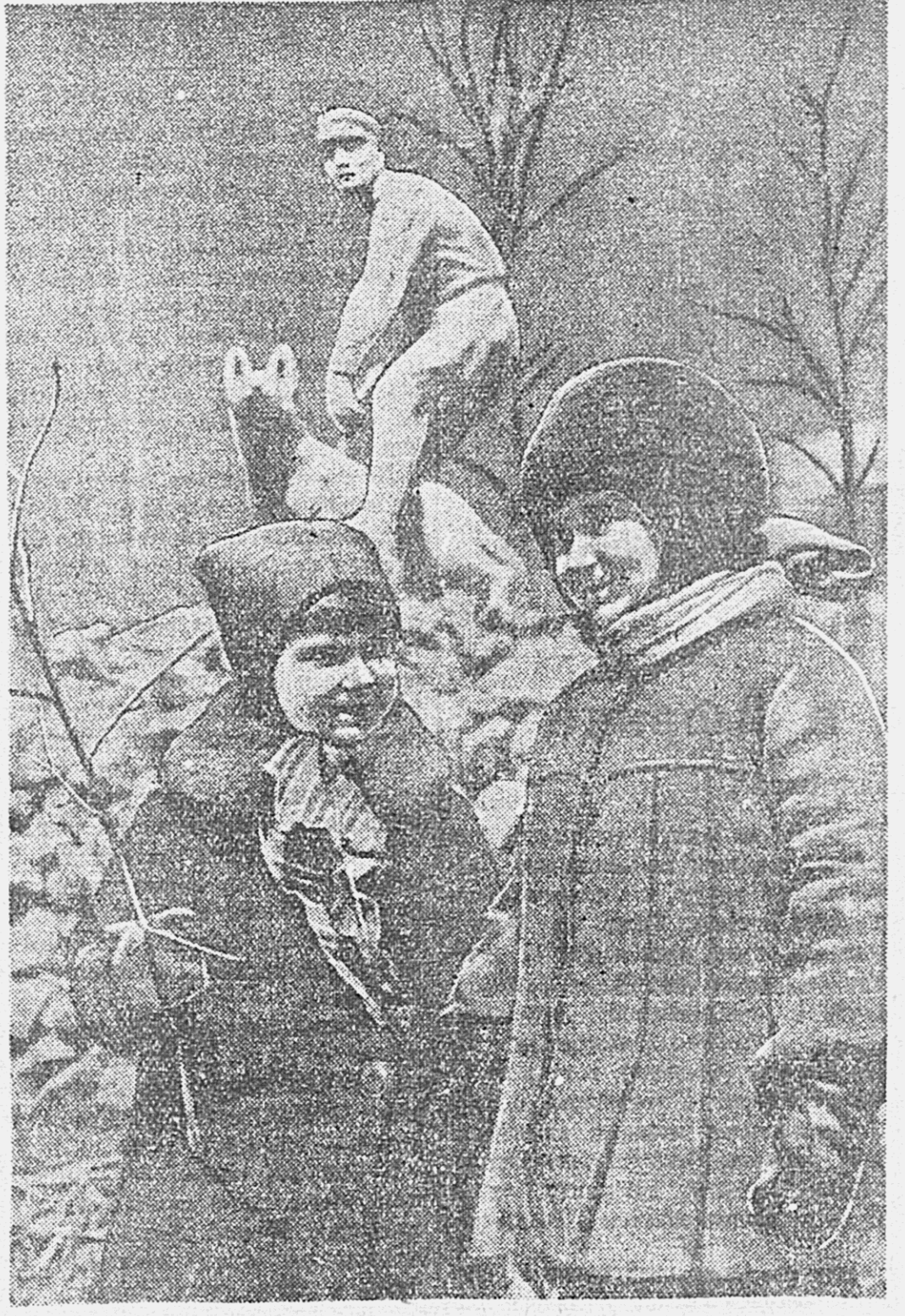
Весна. Первые посетители городского парка.

Добрая тов. Дегтярева была почти неграмотной, но она несколько раз слушала Ксению Фоминичу, которая читала колхозным рассказом о женщинах, о гражданской войне, повести Гоголя... В этом читальном зале — богатство книг, много интересных повестей, газет, журналов, литературы по сельскому хозяйству... В библиотеке много писанных правил библиотечной работы.