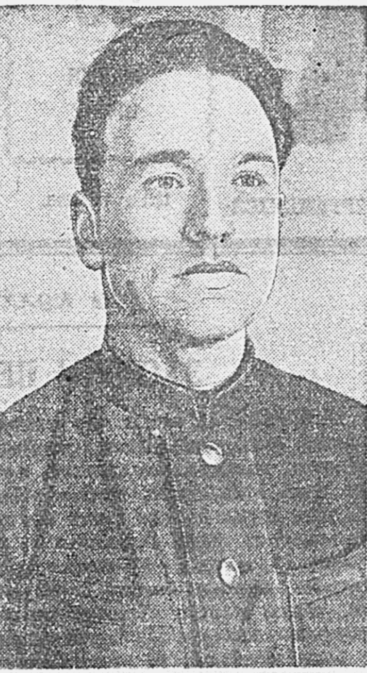
Прошло отчетно-выборное собрание первичной партийной организации ремонтных мастерских Гражданского воздушного флота.

Мы давно уже прокричали о том, что наш колхоз полностью готов к севу.