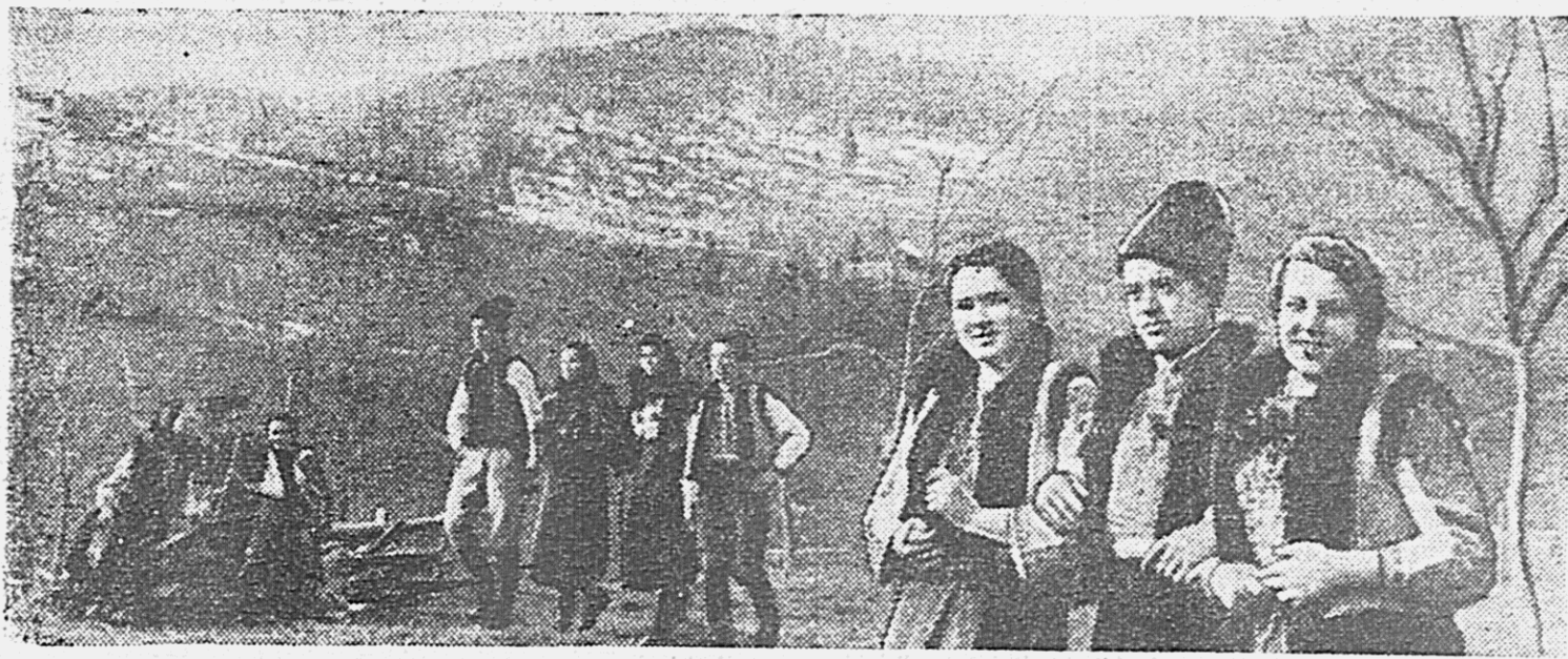
Весна в Карпатах. Молодежь села Виженца (Вишняцкий район, Черновицкой области) на прогулке в выходной день..

ВЕСЕННИЙ СЕВ НА ЮГЕ Весенний сев на полях Юга во второй пятидневке апреля продолжал успешно развиваться. На полях страны на 10 апреля засеяно 8.794 тысячи гектаров яровых культур на 4.490 тысяч гектаров больше, чем было на это время засеяно в прошлом году.