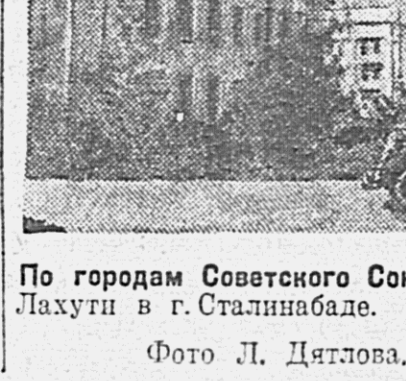
По городам Советского Союза. На снимке: улица Лахути в г. Сталинобаде.

Перед началом строительства по всей трассе состоялись многолюдные митинги. Участники народной стройки обязались досрочно выполнить задание и во что бы то ни стало пустить воду по каналу к XXIV годовщине Великой Октябрьской Социалистической революции.