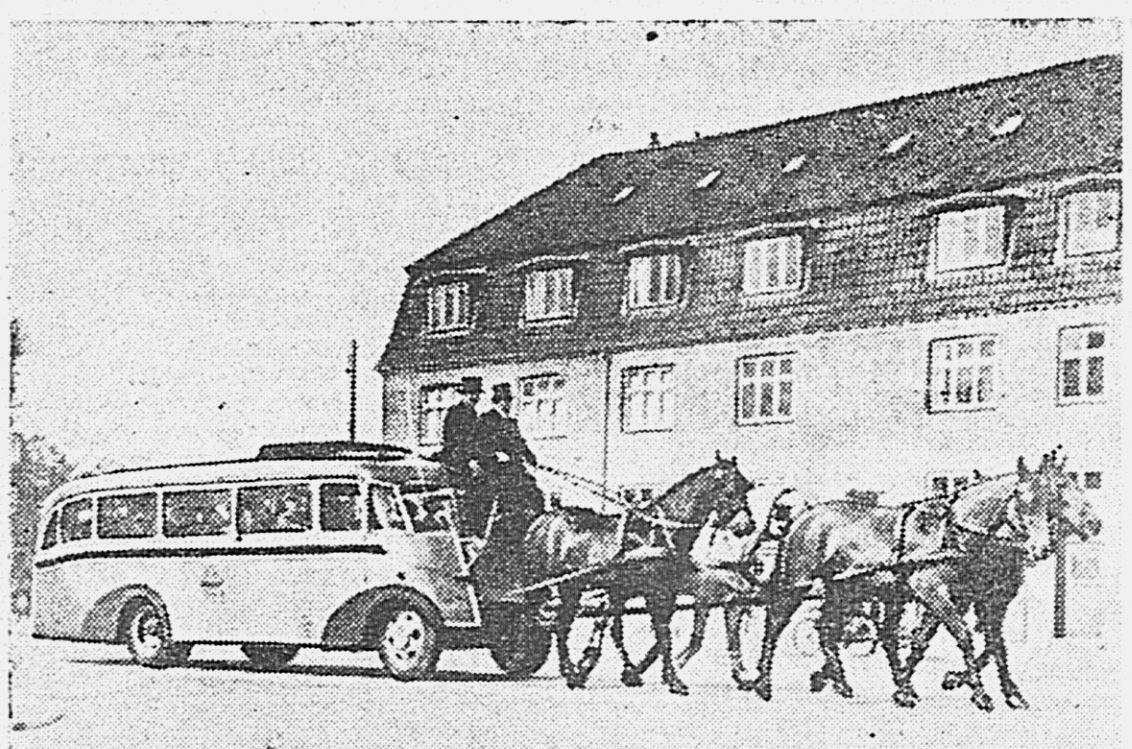
В Данин из-за недостатка бензина прибегают к конной тяге. На снимке: автобус, превращенный в дилижанс, в Копенгагене.

Экзамены в стационарном учительском институте производятся с 1 по 21 августа, а на вечернем и заочном отделениях с 1 по 10 июля. Студенты стационарного института обеспечиваются общежитием. Адрес: Хабаровск, ул. Карла Маркса, 66. 714.