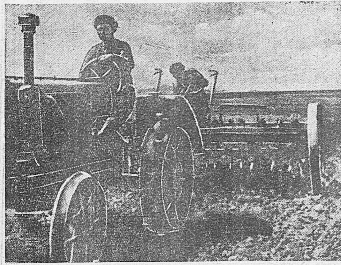
Культивация почвы для посева пшеницы в колхозе «Красное поле» (с. Виноградовка, Хабаровский селский район).

Активно помогают колхозникам и жены командиров подразделения. Комсомолы В. Карпенко и Ф. Гвоздарькова работают на севе трактористками, ежедневно перевыполняя план.