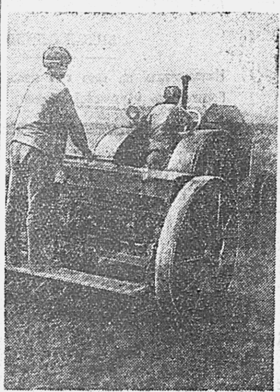
Сев пшеницы в колхозе «Память Ленина», Архаринской МТС.