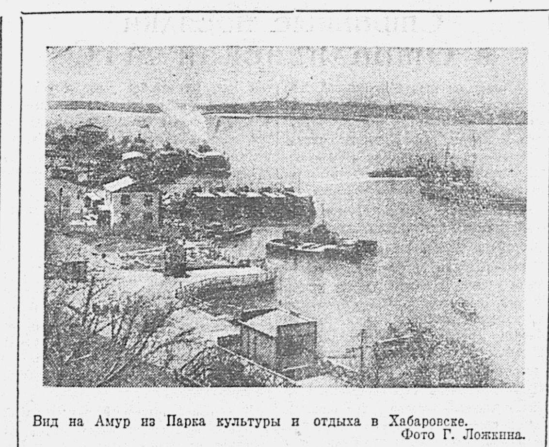
Вид на Амур из Парка культуры и отдыха в Хабаровске.

НЬЮ-ЙОРК, 21 мая. (ТАСС). По сообщению агентства Юнайтед Пресс из Визхи, в достоверных кругах сообщают, что Германия потребовала от США отозвания всех дипломатических представителей из Парижа до 10 июня.