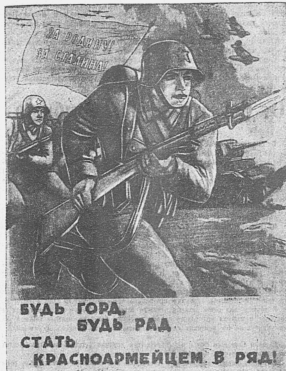
Репродукция с плаката художника В. Иванова, выпущенного издательством «Искусство».