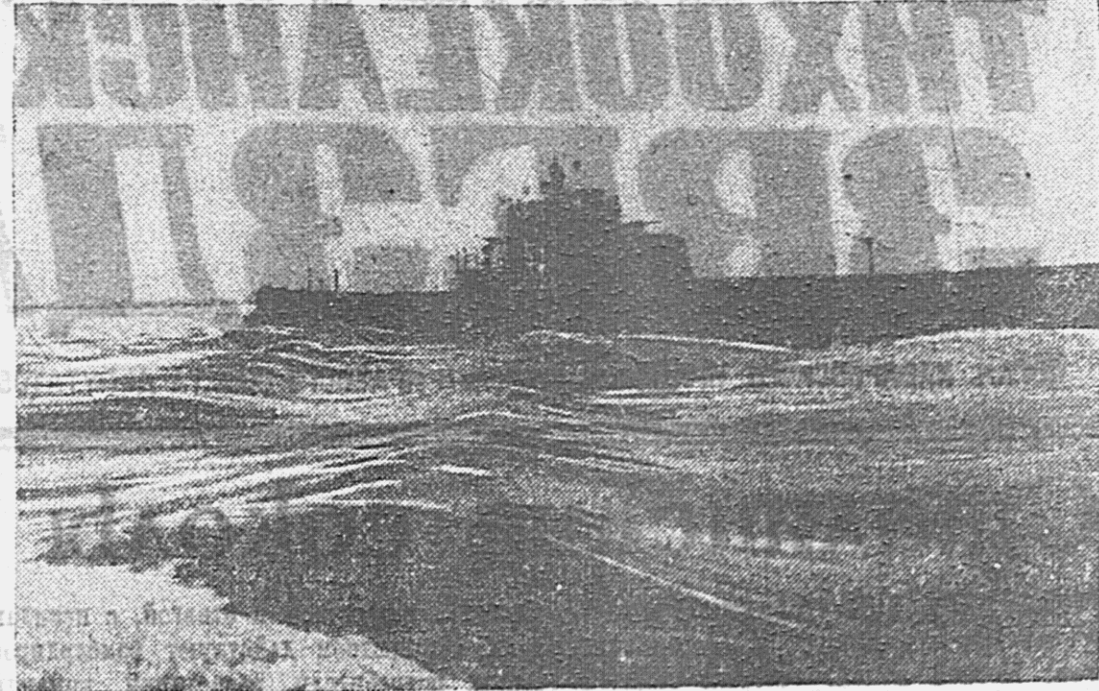
В Краснознаменном Балтийском флоте. На снимке: подводная лодка несет охрану морских рубежей.