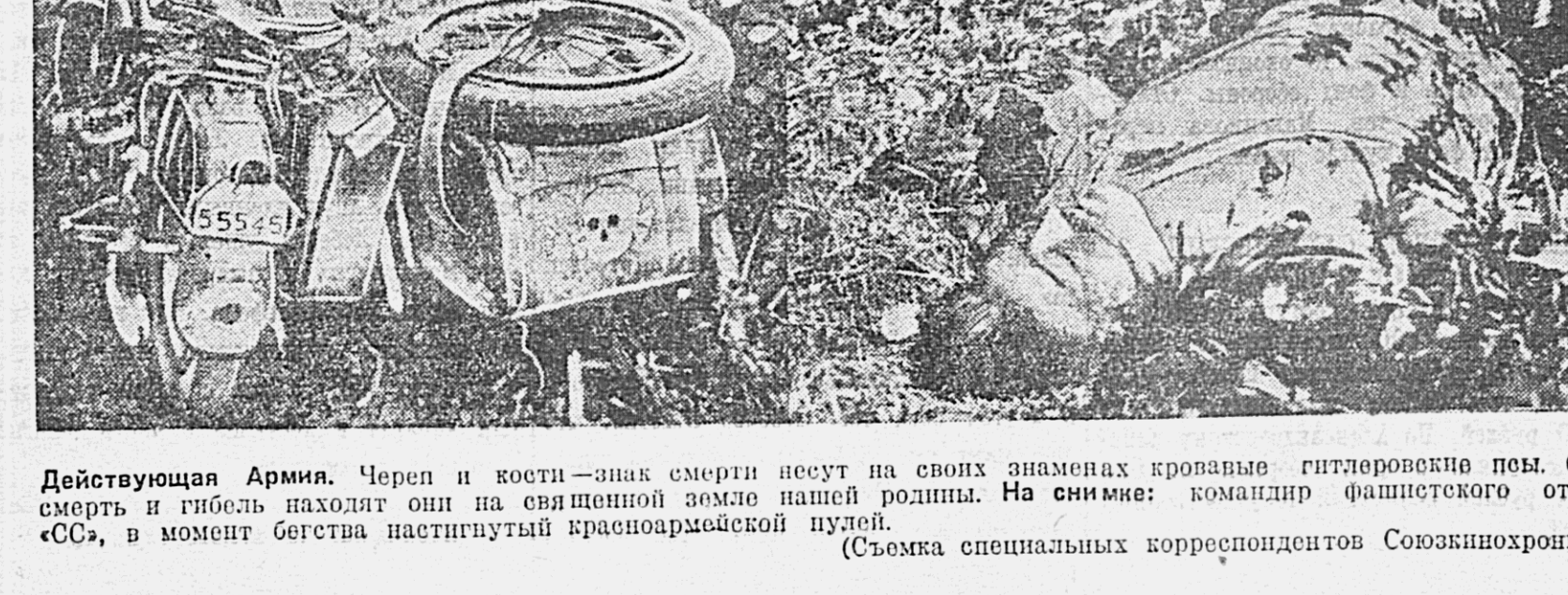
Действующая Армия. Череп и кости—знак смерти несут на своих знаменах кровавые гитлеровские псы. Свою смерть и гибель находят они на священной земле нашей родины. На снимке: командир фашистского отряда «СС», в момент бегства наступивший красноармейской пулей.