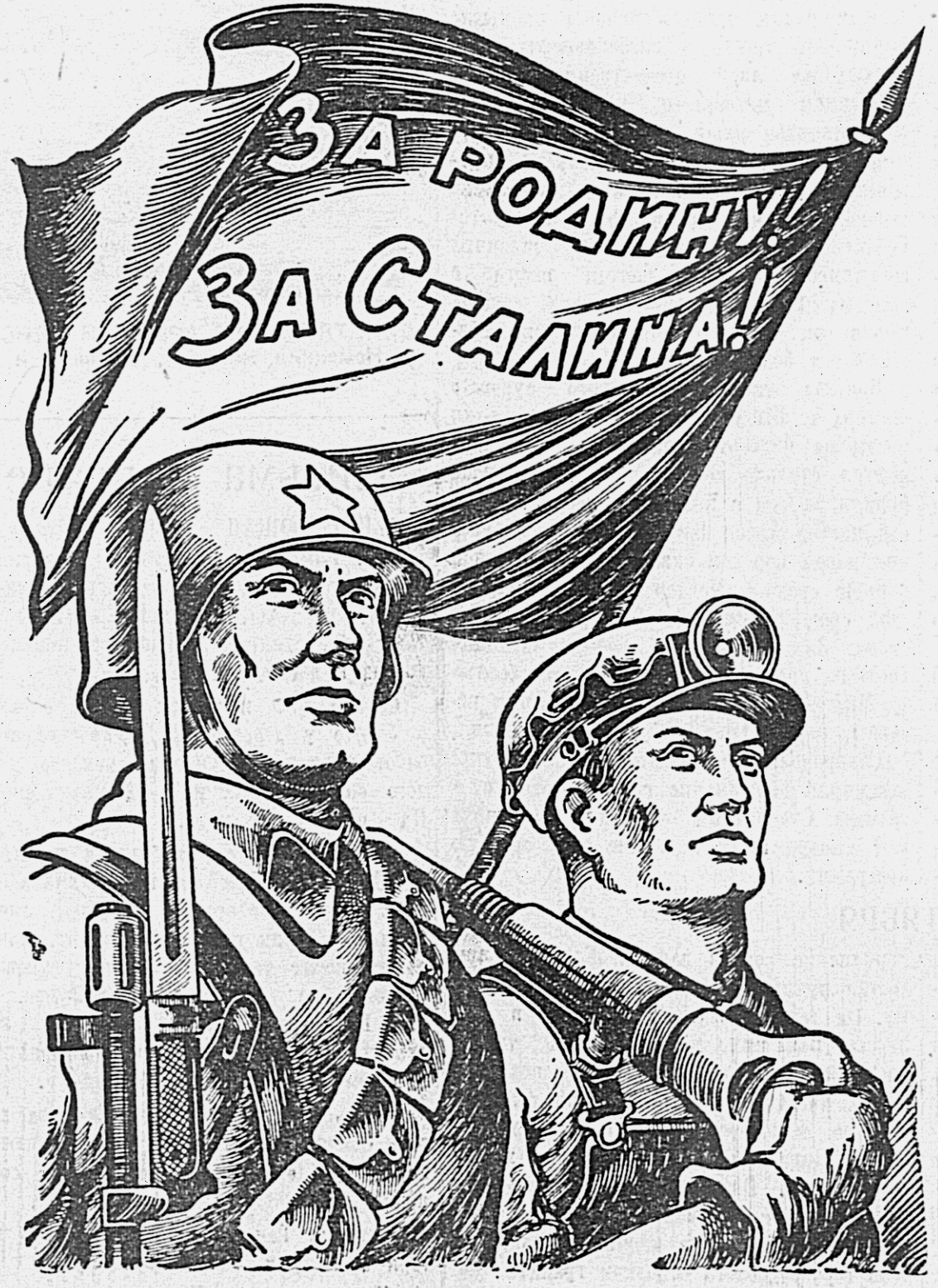
Рис. Л. Дешко.