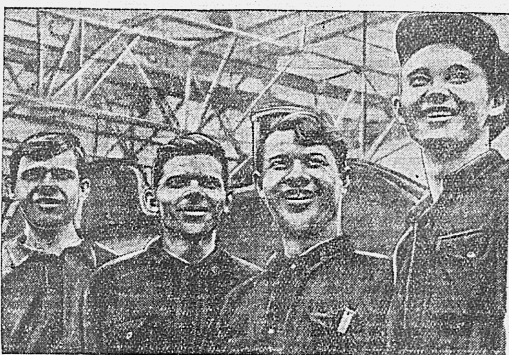
Незадолго до Международного юношеского дня в паровозном депо Хабаровск-2 началось движение двухсотников.