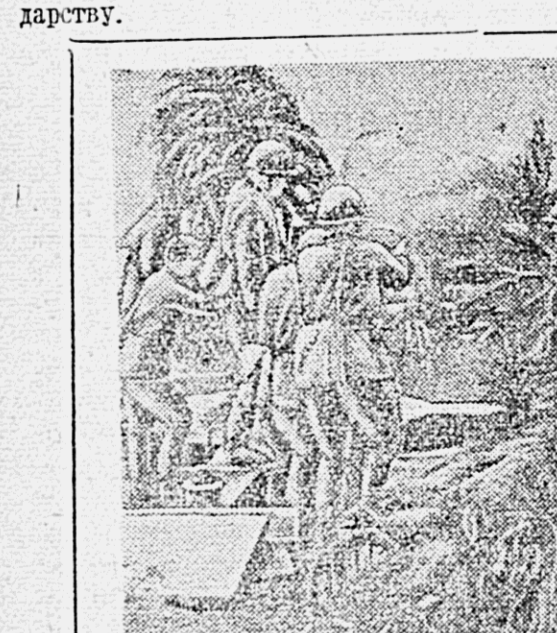
ДЕЙСТВУЮЩАЯ АРМИЯ. На снимках: 1. Лучший оружейный расчет зенитной батареи, сбивший фашистский самолет «Мессершмитт-109».