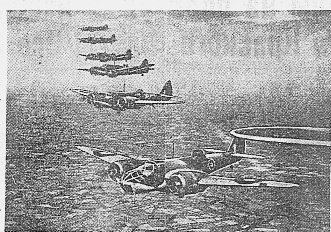
ВООЕННО-ВОЗДУШНЫЕ СИЛЫ АНГИИ. На снимке: подразделение бомбардировочного типа «Бленхейм» в полете.

Так венгерское правительство открыто выразило свое полное, рабочее отношение по отношению к гитлеровской Германии.