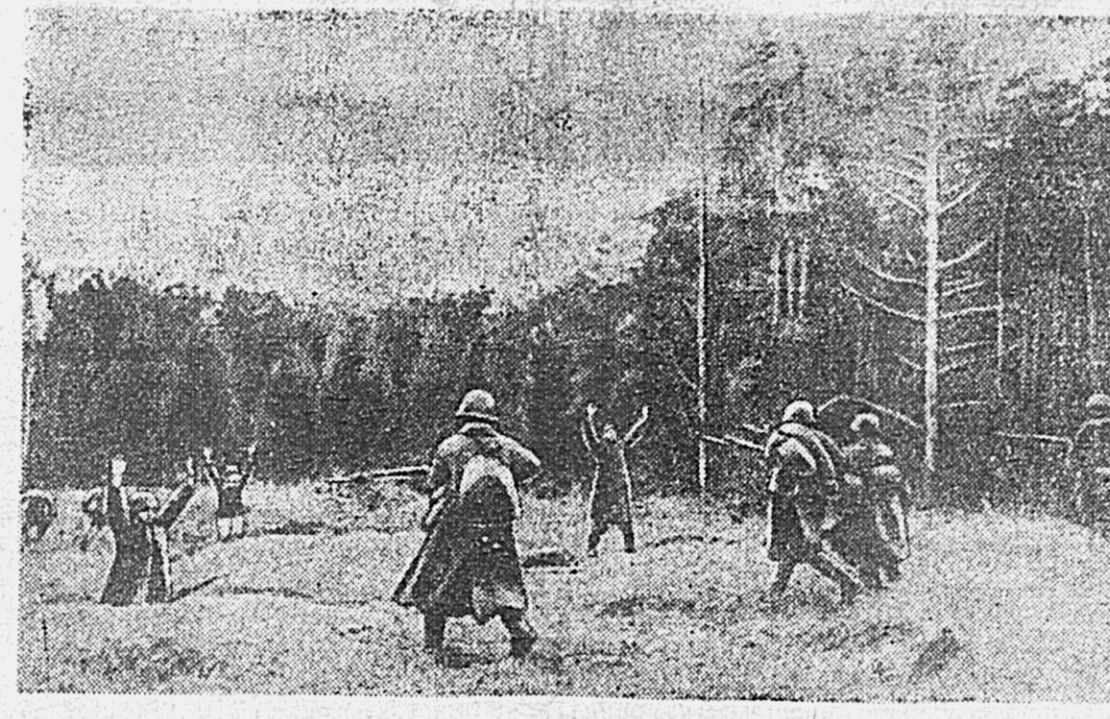
ДЕЙСТВУЮЩАЯ АРМИЯ. На снимках (слева направо): 1. Штыковой атакой наши бойцы выбивают немцев из рощи. 2. Фашисты сдаются в плен. (Западное направление). 3. Подрывными подготавливают взрыв моста.