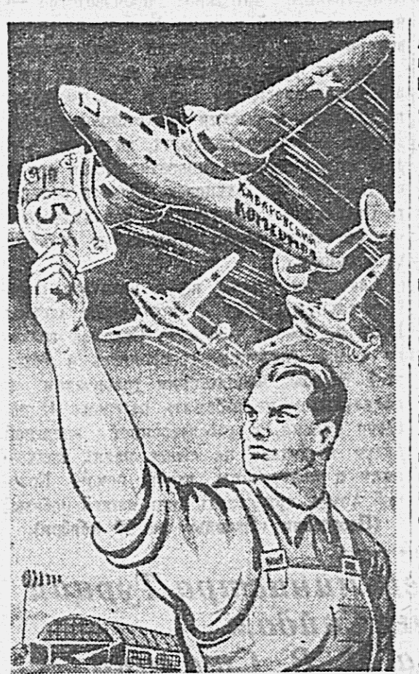
НИКОЛАЕВСН-НА-АМУРЕ, 13 ноября. (ПО ТЕЛЕФОНУ ОТ НАШ. ГОРП.). Комсомольцы Нижне-Амурской области собрали на постройку звена бомбардировщиков «Хабаровский комсомол» 24 тысячи рублей.

В сборе средств на постройку самолетов участвуют не только комсомольцы, но и все трудящиеся Нижнего Амурского края. Актеры областного драматического театра решили дать в фонд постройке самолетов два концерта и отчислить двухдневный заработок. Рабочие и служащие судостроительного предприятия отчислили свой заработок. Активно проходит сбор средств в Ульчском районе.