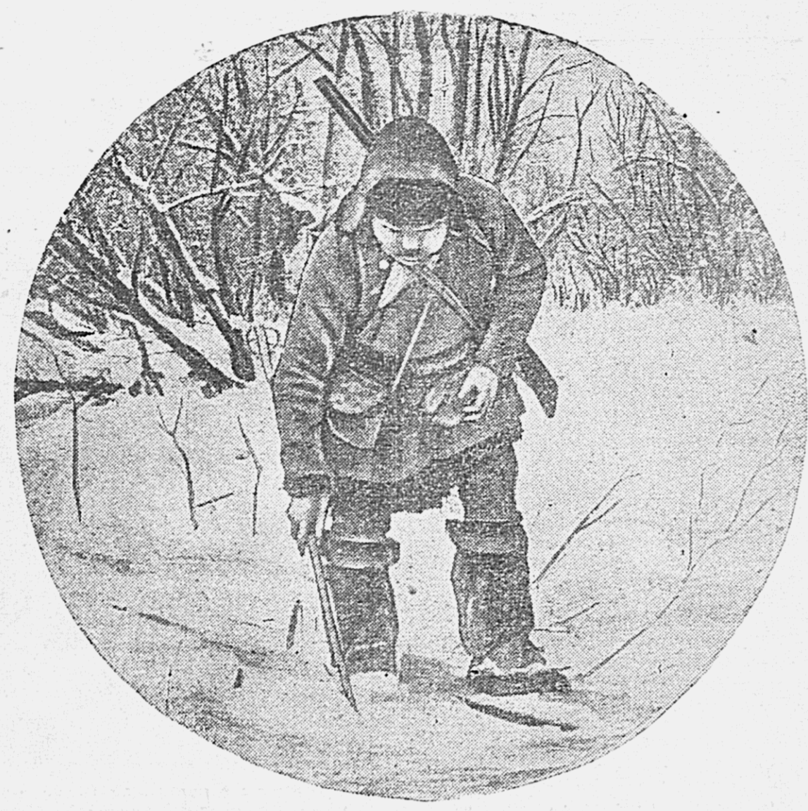
Охотничий сезон в разгаре. Охотник, поставив напкан, тщательно маскирует его снегом.

Бригада Уржачана состоит из четырех охотников. В фонд обороны бригада обязалась сдать шкурки четырех лис, четырех горностаяв и четырех зайцев. Три