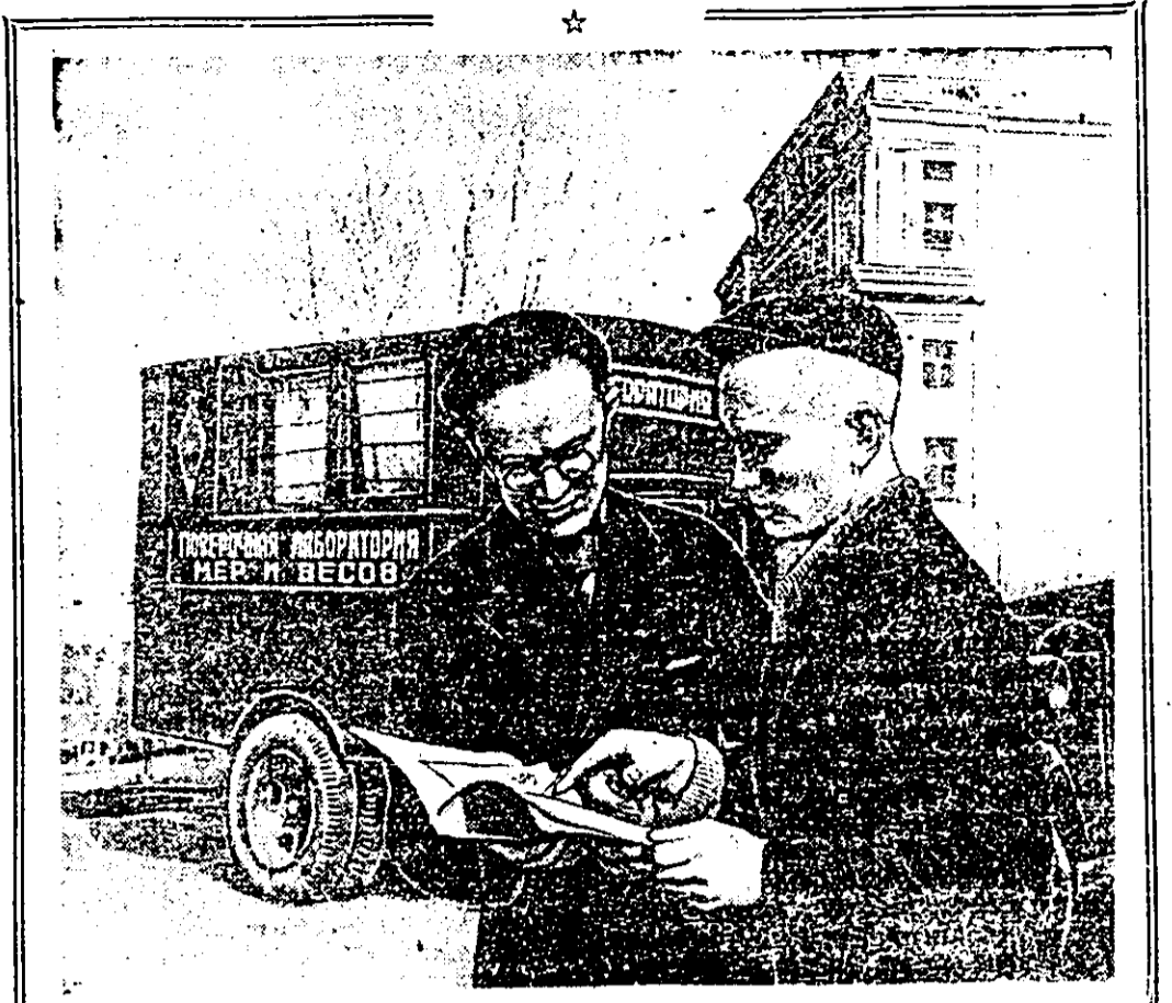
ЛАБОРАТОРИЯ НА АВТОМАШИНЕ. ХАБАРОВСКОЕ управление мер и измерительных приборов закончило монтаж и оборудование первой в крае передвижной лаборатории. Она будет обслуживать колхозы, совхозы, МТС, базы «Заготзерно» и железнодорожные станции.

Технический прогресс в нашей промышленности совершается при активном участии рабочих, инженеров и техников. Передовые формы заочного выполнения последовательной стальной пятилетки являются новаторы производства — рационализаторы и изобретатели.