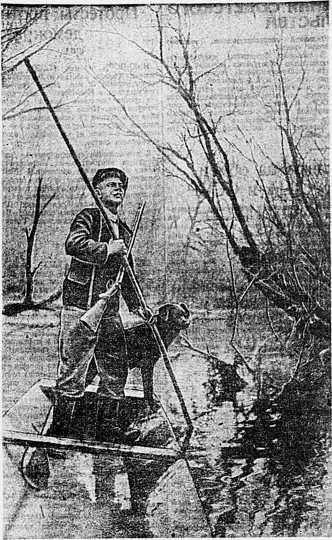
НА ОХОТЕ.

В конце Волочанской улицы, почти у самой городской черты, раскинулся на пригорке необычный лес. Весной весь склонит свои тяжёлые ветви рядом с тонкой берёзой. Виноградная лоза обвивает ствол ели. Ореховое дерево растёт рядом с кленом и сосной.