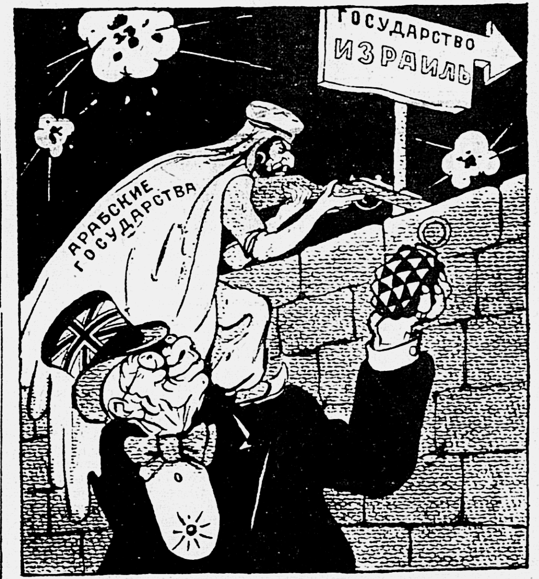
Рассталась Англия с мандатом на палестинские дела. А офицерам и солдатам Приказ из Лондона дала:

Программа национального спасения, принятой Центральным Комитетом коммунистической партии (племени) в Женеве 14-15 апреля 1948 года, и представляла на одобрение французского народа.