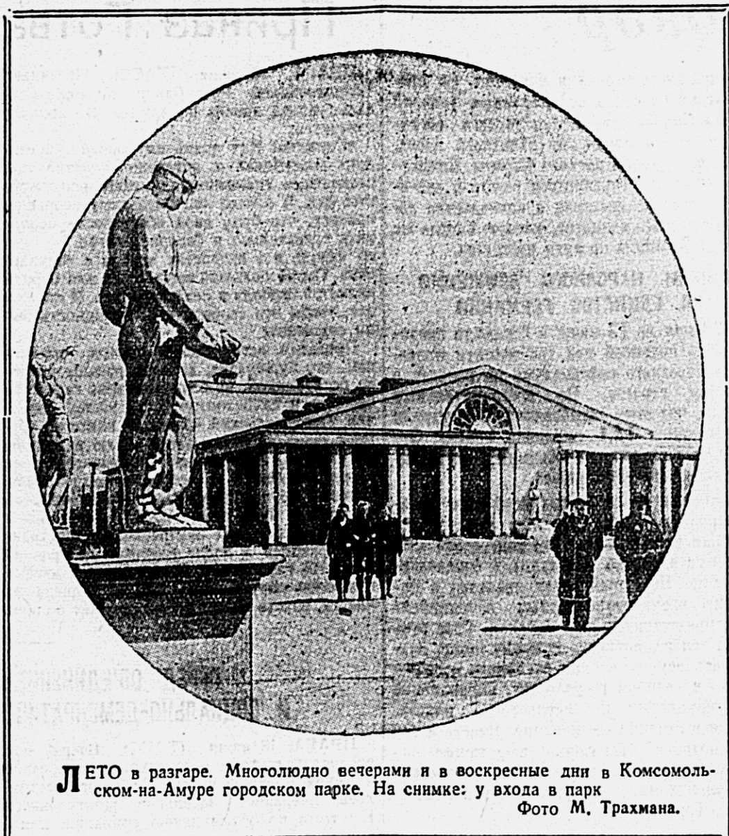
Лето в разгаре. Многолюдно вечерами и в выходные дни в Комсомольском на Амуре городском парке. На снимке: у входа в парк.

Не оправданий ждет от работников местной промышленности и кооперации наш потребитель, а хороших, разнообразных товаров.