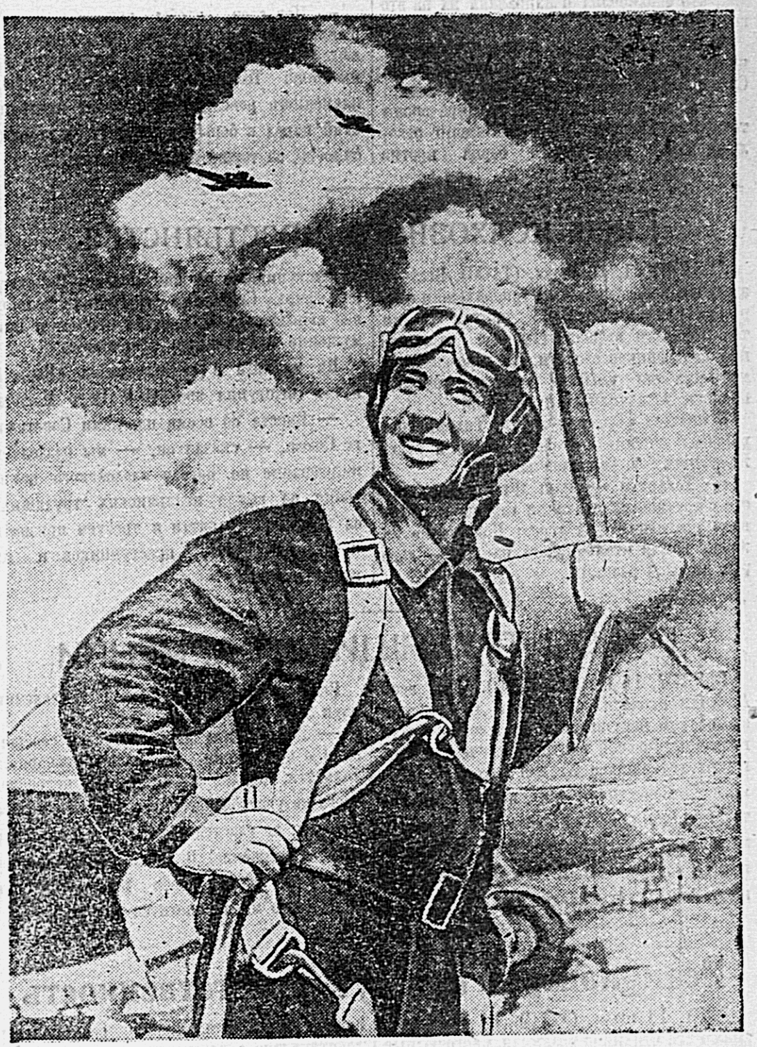
Перед полетом.

Праздник на Тушинском аэродроме является большим, всенародным торжеством. (ТАСС).